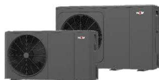
FHA-Monobloc Moyenne Température R32 monphasé 230V et triphasé