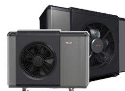
Haute Température CHA R290 triphasé