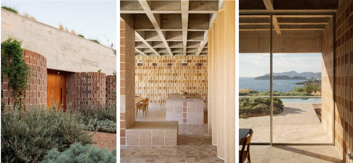
Ca na Birgit_Ted'A architectes ©Luis Diaz Diaz

Cette année, le Grand Prix a été décerné au Temple et Musée Đạo Mẫu à Soc Son (Vietnam), également lauréat de la catégorie Partager l'espace public . Imaginé par le cabinet ARB Architects pour l'artiste Xuân Hinh, le projet puise dans des traditions profondément enracinées et associe esthétique spirituelle et usages contemporains pour créer une atmosphère de sérénité sur un site de 5 000 m 2 . Ce projet à empreinte carbone négative a revalorisé près de 6 millions de tuiles en terre cuite provenant de plus de 500 habitations locales, créant ainsi un lien sacré et unique avec les habitants de la région.