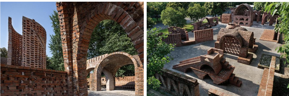
Endless Brick Playground_Prof. Lichao Chen

Vue de l'est, la structure se dessine comme un « horizon de céramique » grâce à une toiture recouverte d'éléments traditionnels en terre cuite. Ce choix technique ancre physiquement l'édifice au sol et crée une continuité topographique avec le relief, estompant la frontière entre architecture et paysage.