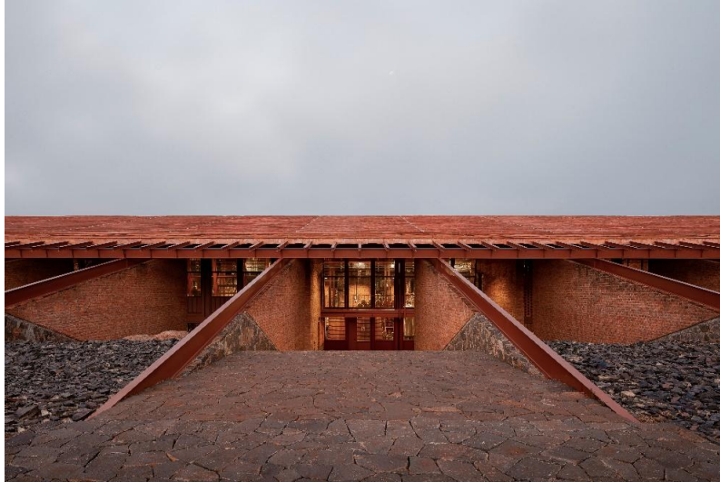
Warehouse and Offices for Clase Azul La Hacienda Jalisco_Atelier Ars

Le cabinet Peris+Toral Arquitectes a obtenu le prix Vivre Ensemble pour un immeuble à usage mixte situé à Barcelone (Espagne), qui comprend 54 logements sociaux locatifs. Le caractère innovant du projet réside dans son « atrium social » bioclimatique, qui relie les appartements aux équipements collectifs situés au rez-de-chaussée. Outre la création d'un espace commun accueillant, la brique fabriquée à partir de biomasse, utilisée pour les façades intérieures et extérieures contribue au confort thermique du bâtiment en maintenant le bâtiment au chaud en hiver et en le gardant frais et aéré en été.