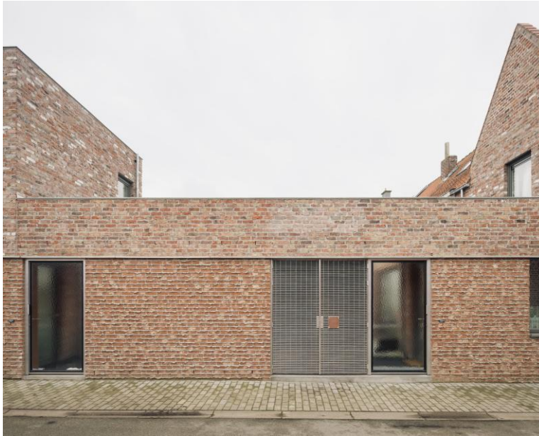
A social and urban infill project in Kortrijk – MAKER

Pendant cinq semaines, les étudiants ont pour mission de concevoir une structure en utilisant la brique rouge comme unique matériau. Entre 2014 et 2024, près de 80 étudiants ont participé aux constructions réalisées sur ce site, érigeant un total de 48 structures en briques. Chaque année, un vote est organisé par les étudiants pour démonter certaines réalisations antérieures afin de laisser place à de nouvelles créations. A la fin de l'année 2024, les 26 structures préservées au sein de Endless Brick Playground révélaient une infinie variété de formes et d'expressions spatiales.