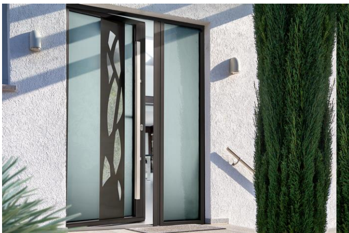
Porte Cristallin S avec fixe