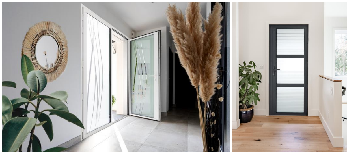
Porte Limbe S en 2 vantaux

Pour un rendu esthétique parfaitement abouti, 4 modèles de la gamme (Mira, Cristallin S, Cima et Laps) permettent d' assortir le décor du vitrage à la couleur de la porte , dans 4 coloris du nuancier (gris 71016 et gris 9007 texturé, Gris 2900 et Noir 2100 sablé). Pour tous les autres coloris du nuancier, le décor est noir des 2 côtés de la porte.