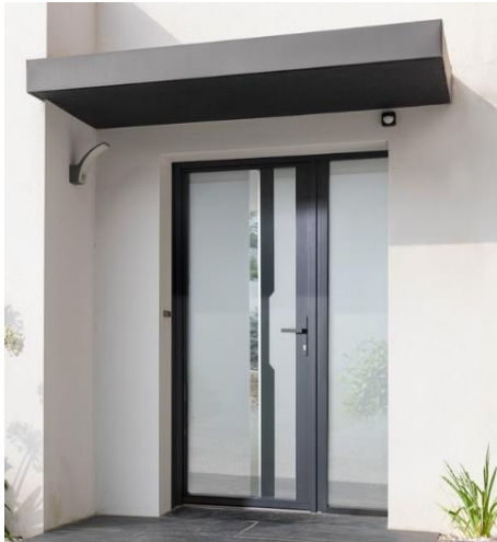
Porte Mira présentée avec fixe latéral

WIBAIE (Groupe Liébot) lance sa nouvelle gamme de portes d'entrée vitrées, en aluminium : Cristalline. L'offre bénéficie d'une conception innovante, plus épurée, plus élégante et offrant encore plus de luminosité. Avec des profilés aluminium amincis, rehaussé d'un nouveau design plat et droit, les portes Cristalline affichent un style résolument moderne.