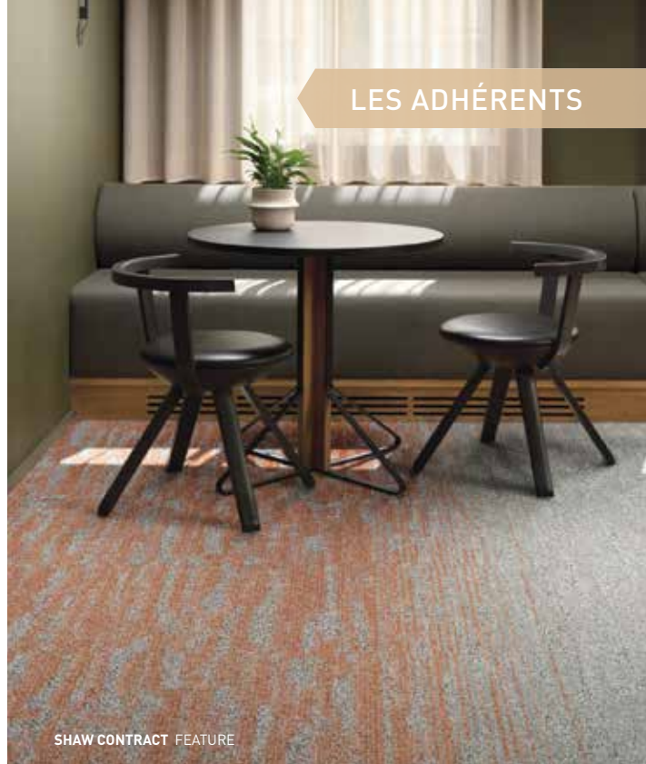
SHAW CONTRACT FEATURE