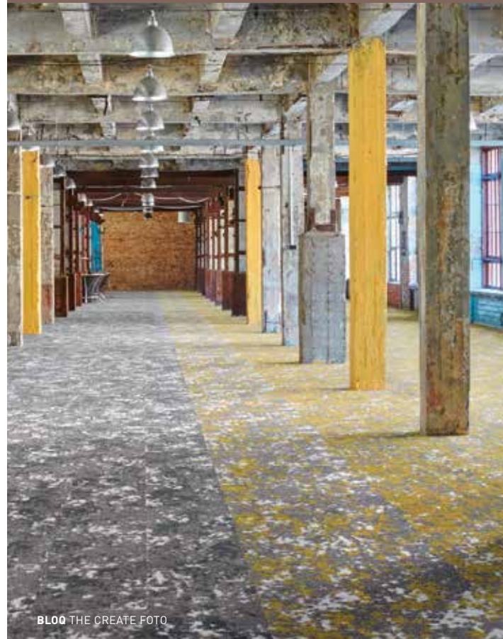
BLOO THE CREATE FOTO