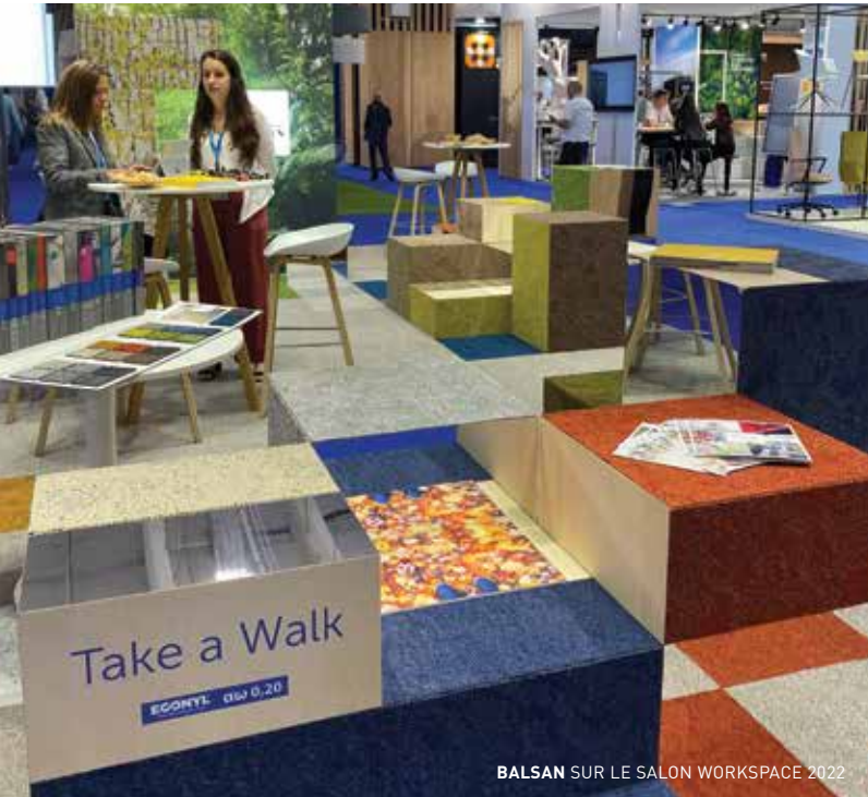
BALSAN SUR LE SALON WORKSPACE 2022