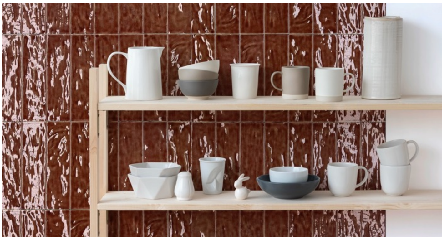
TILE OF SPAIN - Marque : Cerámica Da Vinci

Pour contrer la grisaille extérieure, la céramique espagnole ose également réintroduire la couleur par le prisme de la matière et de la brillance. Beiges poudrés, verts sauge, bruns patinés, ces nuances s'imposent comme un prolongement naturel issus de la terre. L'hiver se réchauffe grâce à des teintes et des surfaces qui semblent travaillées à la main. Ici la faïence, au format brique et à la teinte brune rougeâtre, évoque la terre cuite vernissée. La surface irrégulière et la finition brillante agissent comme un miroir chaleureux, diffusant une lumière ambrée qui réveille instantanément l'atmosphère d'une cuisine ou d'une salle de bain.