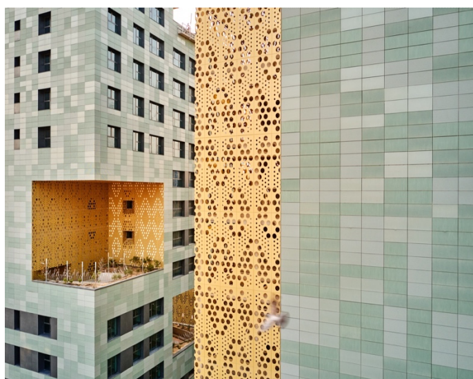
TILE OF SPAIN - Marque : Faveton Immeuble Wafra Living Collection : Acqua / Wavy Acqua Formats : 500x1000 mm.

Les façades des bâtiments requièrent des matériaux résistants aux intempéries et au rayonnement solaire. A ses atouts techniques s'ajoutent des qualités esthétiques. Les architectes optent également pour la céramique espagnole pour la liberté créative qu'elle offre. Elle permet la création de façades originales et personnalisables qui se démarquent dans le paysage urbain : des associations de formes, de dégradés de couleurs, des harmonisations avec le zinc, le métal ou encore le bois.