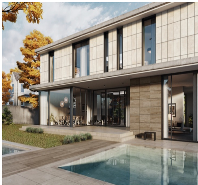
TILE OF SPAIN - Marque : Exagres Villa Privée Collection : Exatech Formats : 39,7x80, 39,7x100, 39,7x120, 39,7x160, 60x80, 60x100, 60x120 et 60x160 cm.

TILE OF SPAIN a présenté lors du CEVISAMA 2024, rendez-vous incontournable des aficionados du carrelage, des solutions pour habiller les façades des bâtiments tertiaires, des logements collectifs et des maisons individuelles. Robuste, ce matériau a une durée de vie estimée à 50 ans, son impact environnemental est ainsi réduit. A l'heure où les normes environnementales sont plus exigeantes pour les maîtres d'ouvrage et d'œuvre, la céramique espagnole fait sa place parmi les matériaux qui répondent aux plus importantes normes européennes telles que les certifications des programmes internationaux de construction durable LEED, BREEAM®, VERDE ou encore DGNB.