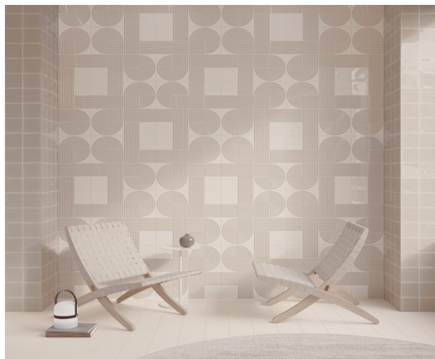
TILE OF SPAIN – Marque : WOW Collection : Twister Format : 12,5x12,5 cm