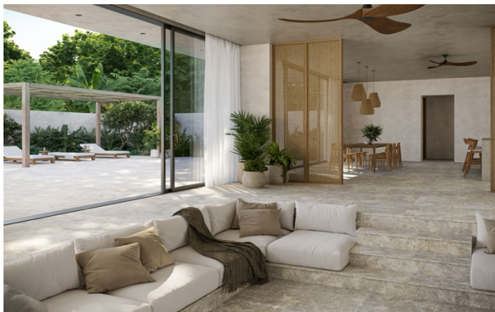
TILE OF SPAIN - Marque : Cerámica Mayor Collection : Eterna Formats : 60x120 et 37.5x75 cm

L'automne arrive mais pas question de renoncer aux joies du plein air ! En cette saison où les journées restent longues et agréables, il est encore possible de profiter de sa terrasse. Par exemple, TILE OF SPAIN propose une sélection de carrelage qui assure une continuité parfaite entre le salon et l'extérieur. Une ambiance beige qui se fond dans l'environnement extérieur et qui adoucit la cuisine en se mariant avec le bois des meubles ou encore un effet pierre pour un intérieur intemporel.