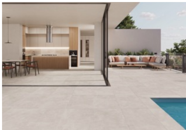
TILE OF SPAIN – Marque : KTL Cerámica Collection : Columbia Formats : 100x100 R, 60x120 R, 60x60 R, 45x45 et 30x60 cm