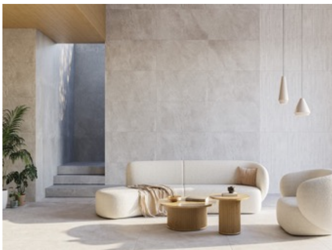
TILE OF SPAIN – Marque : Ibero Collection : Lune Formats : 60x120, 90x90, 60x60 et 30x90 cm

A l'approche de la saison froide pour pallier le manque d'ensoleillement et créer une ambiance chaleureuse et accueillante, les couleurs claires comme le taupe, le blanc cassé ou encore le beige sont des alliés précieux. Leur pouvoir réflecteur permet de capter la lumière naturelle et de l'optimiser, diffusant ainsi une douce clarté dans toute la pièce. Cette luminosité accrue contribue au bien-être des occupants en agrandissant visuellement l'espace et en créant une atmosphère paisible et relaxante. Les industriels espagnols préconisent d'utiliser plusieurs nuances d'une même couleur, de la plus claire à la plus foncée afin de donner de la profondeur à une pièce et d'accentuer cet effet.