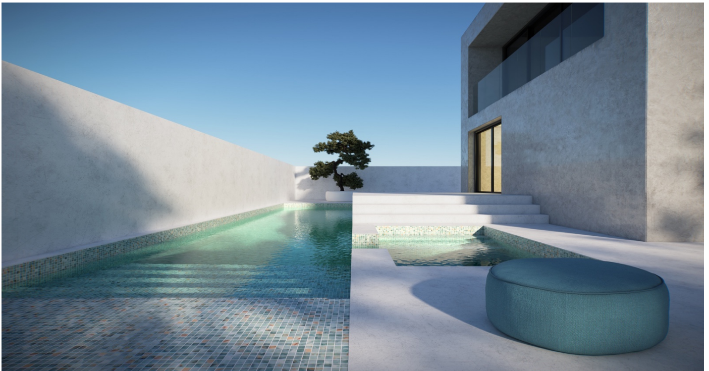
TILE OF SPAIN - Marque : Altoglass Collection : Elite Pool Format : 2,5x2,5 cm.

Les pièces céramiques offrent une grande variété de designs , de combinaisons, d'effets, de contrastes qui se fondent dans le paysage. Avec des teintes qui évoquent l'eau, le feu et la terre, cette tendance rapproche la nature de chaque espace . Une gamme riche de bleus et d'émeraudes prédomine pour habiller les abords et même le fond des piscines. Pour les structures plus singulières ou encore les escaliers , les pièces de céramique espagnole peuvent être modifiées sur-mesure afin d'assurer une continuité visuelle et esthétique avec les abords de la piscine. Par exemple, les transats installés sur les marches des piscines reposent sur des socles aménagés avec des petits carreaux, teintés d'un dégradé de vert pour se marier avec le fond de la piscine. Elles permettent également de délimiter les espaces : la plage aquatique, la plage extérieure, le fond de la piscine.