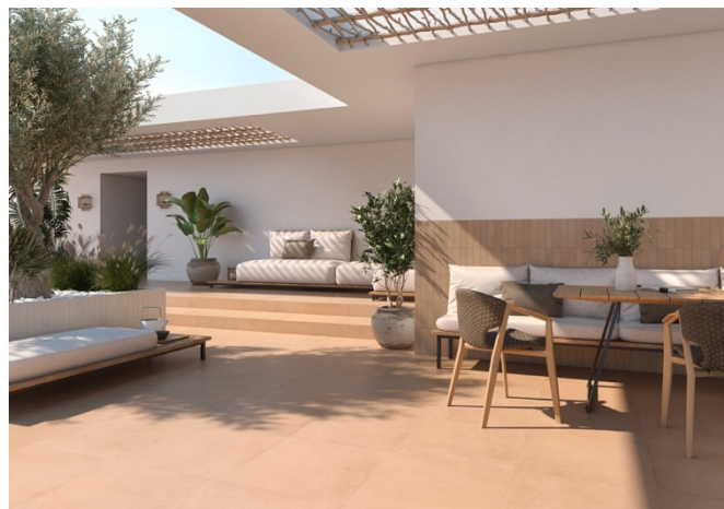
TILE OF SPAIN - Marque : Keraben Grupo Collection : Terracota Formats : 120x60, 90x90, 60x60, 30x90, 20x20 et 6x25 cm.