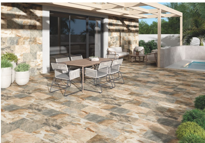
TILE OF SPAIN - Marque : Cerámicas Mimas Collection : Pizarra Format : 30x60 cm.

Pour le confort des poseurs , les industriels espagnols ont pensé à tout car souvent l'aménagement d'une terrasse nécessite le coulage d'une dalle afin que le revêtement au sol puisse être posé dans les règles de l'art. Afin de palier à ces travaux, les industriels espagnols proposent l'installation directe de céramique double épaisseur qui peut être posée sans colle sur du grave, de l'herbe et même du sable.