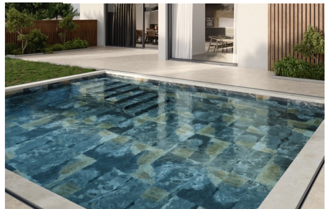
TILE OF SPAIN - Marque : El Molino – Hijos de Cipriano Castelló Alfonso Collection : Florencia Formats : 60x60, 60x120, 45x89,5, 45,5x90 et 30x60 cm.