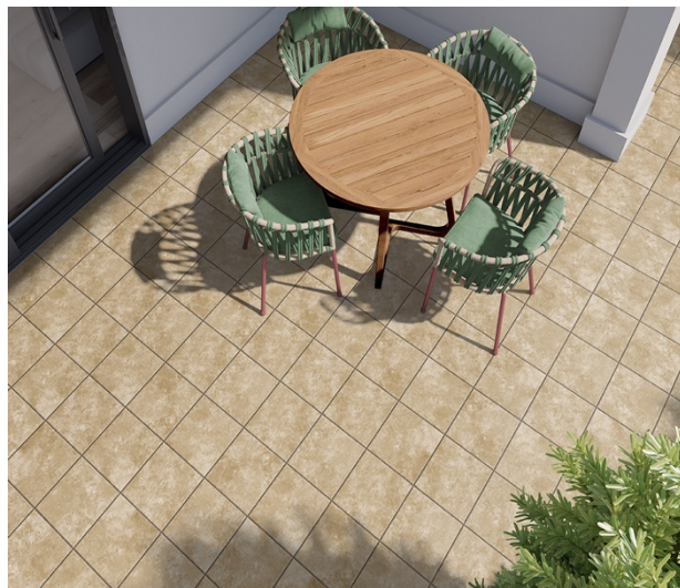
TILE OF SPAIN - Marque : Superceramica Collection : Mulhacen Format : 33,3x33,3 cm.

Les joints sont aussi personnalisables en contraste ou assortis, rectifiés ou irréguliers. Chaque détail a été pensé avec soin pour répondre à toutes les demandes.