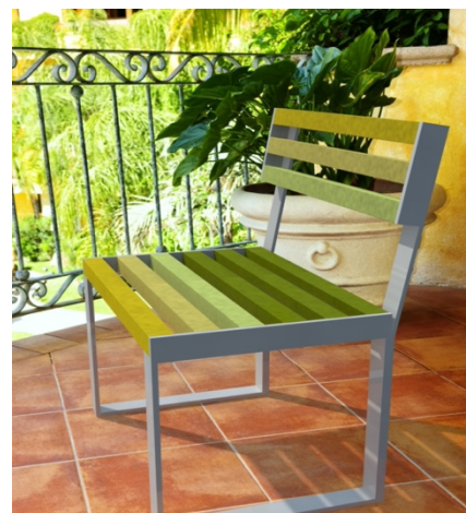
TILE OF SPAIN - Marque: Natucer Collection : Classic Linea mobiliario urbano Format : 63x50,5 cm.

Ils proposent de parsemer de la céramique jusque dans la personnalisation du mobilier extérieur. Travaillées sur-mesure, les pièces façonnent l'assise et le dossier de chaises ou de bancs, le plateau d'une table de salon de jardin, le revêtement de jardinières pour s'harmoniser aux sols ou créer du contraste. Jeux de formes, de couleurs et de textures, l'imagination créative est sans limite !