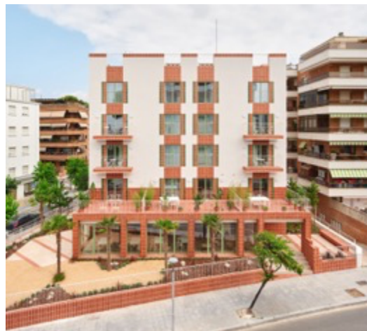
Architectes : NUA arquitectures Projet : Conversion of an abandoned building into 27 flats Lieu : Salou