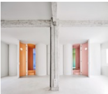
Architectes : Cloud House Projet : Studio Animal Lieu : Madrid