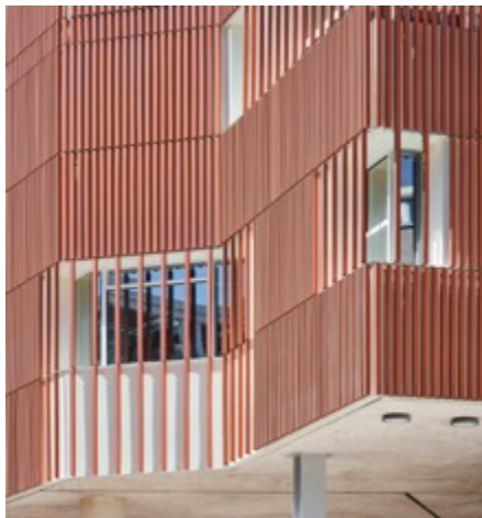
Architectes : Padilla Nicás Arquitectos+ Mariluz Sánchez Projet : Alterations and extensions to Buenavista Cultural Centre Lieu : Madrid