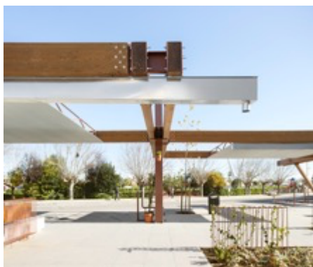
Architectes : La Errerìa Projet : Square + bus-stop Lieu : Vinaròs