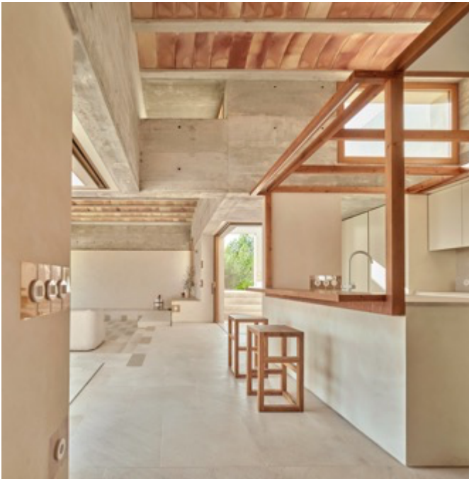
Architectes : Ripoll-Tizon Architecture Studio Projet : House in Puntiró Lieu : Palma de Majorque, Iles Baléares