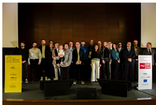
Cérémonie de remise des prix 22 ème édition des Ceramic Awards CEVISAMA

Tile of Spain Awards Architecture Interior design