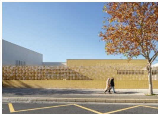
Architectes : Magén Arquitectos Projet : María Zambrano Infant School Lieu : Zaragoza

*TILE OF SPAIN est le porte-parole international de l'ASCER qui soutient, défend et promeut l'industrie de revêtements sols et murs en céramique espagnole. Le siège est implanté à Castellón de la Plana, cœur historique de l'industrie de la céramique en Espagne. Elle réunit 110 adhérents, soit 95 % de la production sectorielle. www.tileofspain.com