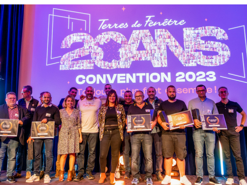
Remise des Awards

En parallèle de ce salon, Terres de Fenêtre a organisé une grande table ronde sur la thématique de la menuiserie de demain . De grandes références du secteur telles que Deceuninck, Saint-Gobain Glassver, Ferco et Sepalumic ont eu l'occasion d'intervenir sur cette thématique. Ce temps d'échange privilégié avec les différents acteurs du monde de la menuiserie a été l'opportunité pour les partenaires et leurs collaborateurs de faire le point sur les tendances actuelles du marché et sur les innovations à venir .