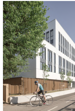
La lame L180 sur le projet de logements collectifs AEROSKY à Nantes