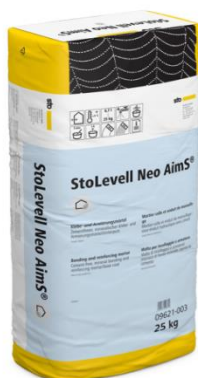
Nouveau sous-enduit d'ITE StoLevell Neo AimS®