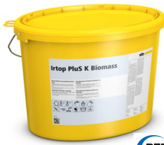
Irtop PluS Biomass : la 1 ère gamme de revêtements d'imperméabilité issue de la biomasse certifiée REDcert 2