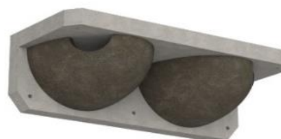
Nouveau nichoir en applique de façade pour les hirondelles de fenêtre

Retrouvez toute l'actualité de la façade sur www.sto.fr