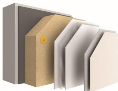
Nouveau système ITE StoTherm Wood AimS® avec isolant en fibre de bois