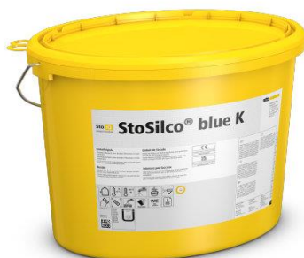
Nouvel enduit siloxané StoSilco® blue sans protection de film biocide