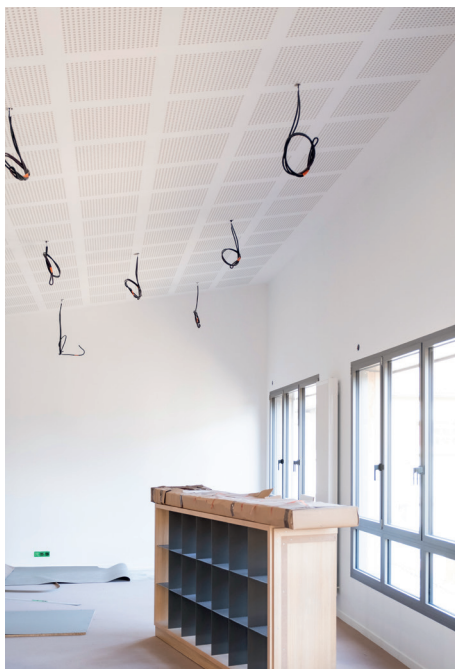
Plafond avec plaque de plâtre acoustiques perforées CREASON C10 n°8