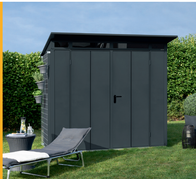
Abris de jardin Berry modèle Modern : au prix public indicatif à partir de 2 769.60€ TTC.

Ce rendez-vous international du bâtiment outre-rhin a été marqué, comme toujours, par les nombreuses nouveautés du leader Hörmann pour ses activités historiques en portes d'entrée, portes de garage et systèmes domotiques assurant la gestion de ses ouvertures, mais pas seulement. En effet, Hörmann y a dévoilé également de nouvelles solutions, pour la création d'espaces de rangement au jardin (abris de jardin et supports à bois de chauffage).