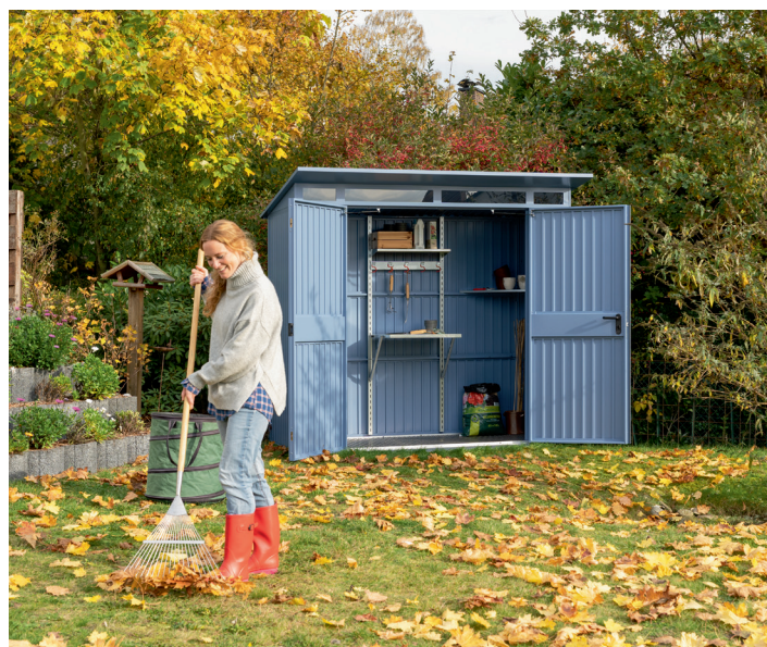
Abris de jardin Berry modèle Classic : au prix public indicatif à partir de 2 425.20€ TTC.