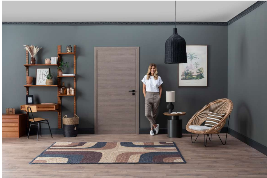
Décor réalisé avec la porte KREATION (M05) teinte chêne taupe Lien de la vidéo Master Class : https://youtu.be/qxVUg5iTZOg

L'ambiance VINTAGE CALIFORNIEN s'inspire des maisons californiennes des années 50 et 70. Elle se caractérise par des couleurs vives, des motifs audacieux et une utilisation de bois et de cuir.