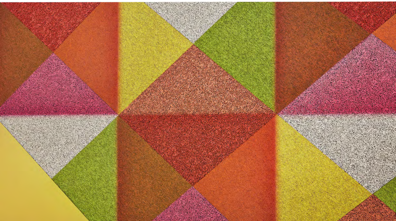
DESSO X RENS gamme Hopscotch

Fidèle à la démarche de la marque selon laquelle chaque revêtement de sol a le droit à une seconde vie, Tarkett lance DESSO X RENS, une collection de moquettes réalisée grâce au réemploi de matériaux en collaboration avec le cabinet d'études de design hollandais Studio RENS.