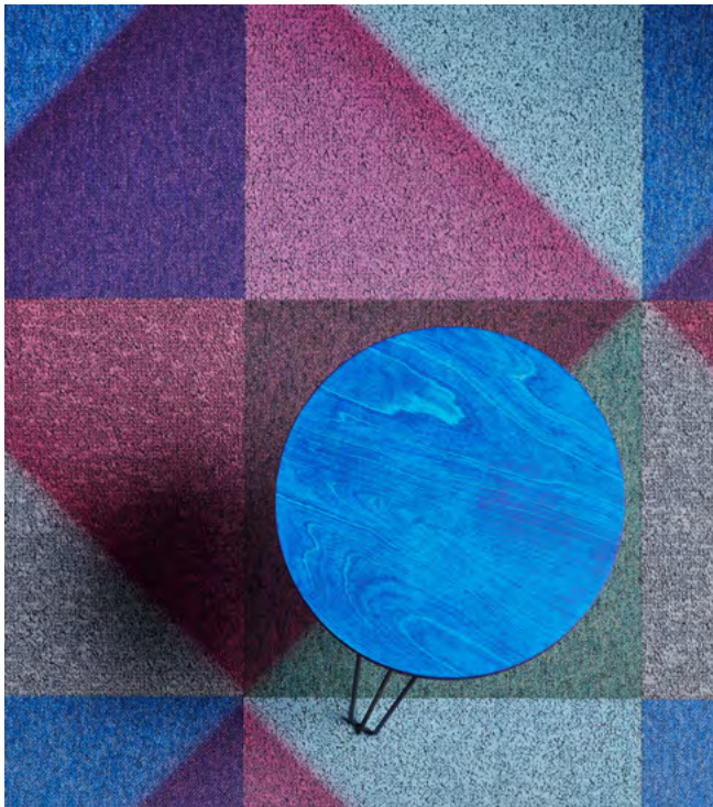
DESSO X RENS gamme Tangram

La collection DESSO X RENS est livrée en série avec la sous-couche EcoBase® 100 % recyclable, qui contient en moyenne 80 % de craie recyclée provenant de l'industrie locale de l'eau potable. En fin de vie, les dalles de moquette peuvent être recyclées en une nouvelle matière première dans l'usine Tarkett de Waalwijk, aux Pays-Bas. La collection est certifiée Cradle to Cradle® Gold et s'inscrit en complément dans le programme de collecte et de recyclage ReStart® de Tarkett.