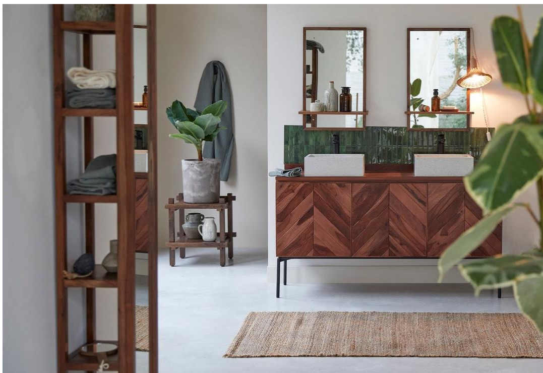
Collection Ismaël, meuble en palissandre massif, 1099€

Tikamoon présente ses collections en bois massif dédiées à la salle de bain !