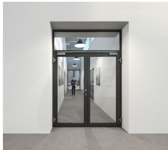
DR : WICONA

La porte WICSTYLE 65 N NG sans rupture thermique relève d'une conception modulaire. Fidèle à la logique less is more qui conduit les développements produits de WICONA depuis plusieurs années, cette nouvelle génération de porte est conçue de façon symétrique avec un profilé mono chambre de 65 mm : les mêmes profilés de châssis peuvent être utilisés pour les ouvertures intérieures et extérieures, les joints, parclofes, profilés de connexion et autres composants sont normalisés. A ce titre, les pièces peuvent être utilisées sur toutes les séries de façades, de fenêtres et de portes WICONA assurant une liberté architecturale et la cohérence de conception. Outre l'unité visuelle , ce concept permet aux fabricants d' optimiser les stocks et les temps de fabrication grâce à la mutualisation des étapes de traitement, des accessoires, et outils et ainsi de gagner en rentabilité.