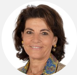
Dominique Estrosi Sassone