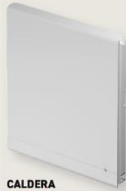
CALDERA INERTIE LAVE

CHAUFFAGES À INERTIE AVEC DE LA PIERRE DE LAVE D'Auvergne. LE CONFORT EST GARANTI, L'ORIGINE FRANCE AUSSI.