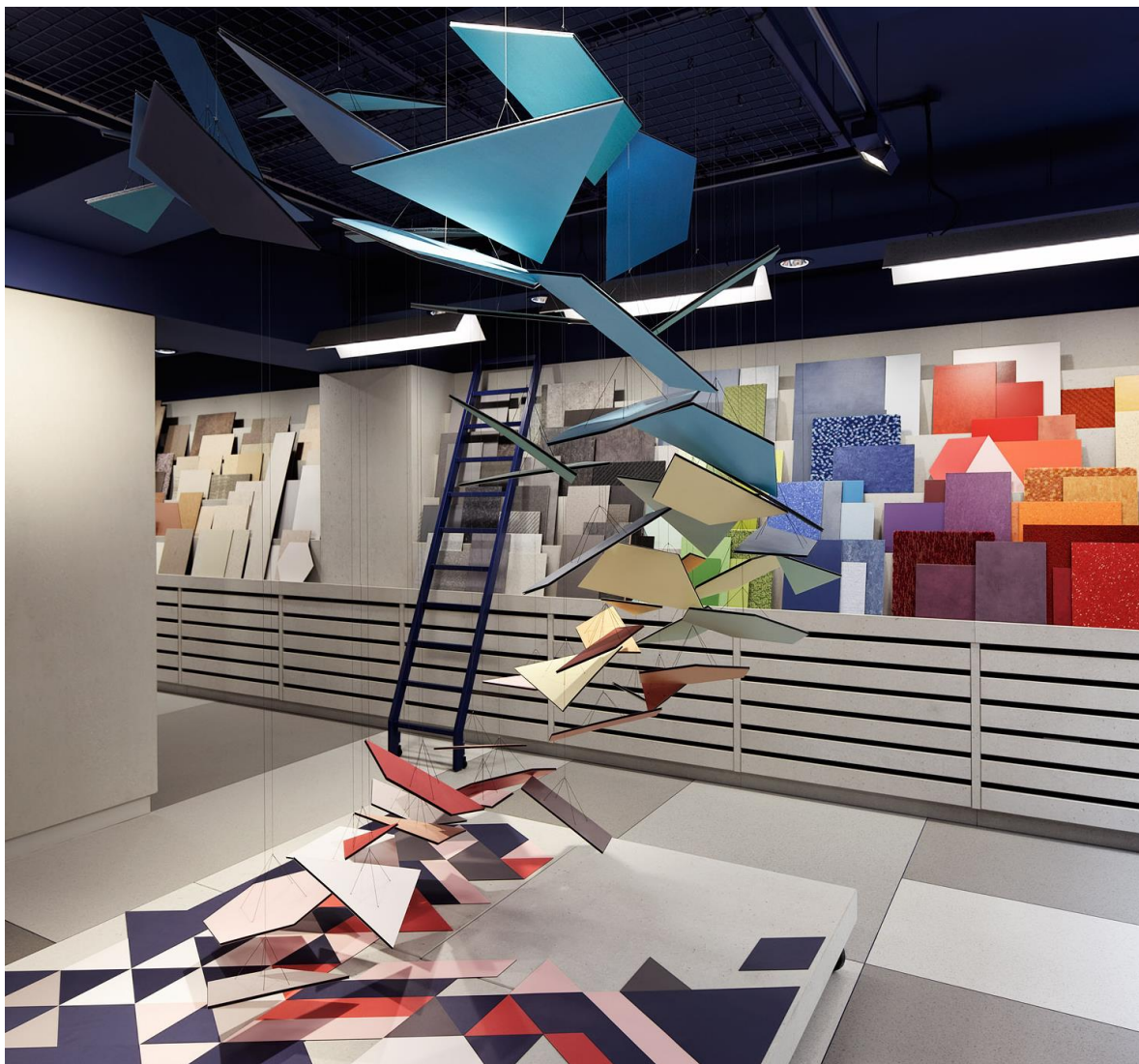
Exposition de travail de chutes de revêtements de sols à l'Atelier Tarkett, 2021

Du 12 au 15 mars 2024, 24 étudiants participeront à ce projet commun et mettront à l'œuvre leur créativité et connaissances acquises dans les domaines de l'ébénisterie, du textile, des matériaux souples, du moulage ou encore de la céramique, pour détourner les revêtements créés par Tarkett, tout en s'interrogeant sur leur usage.