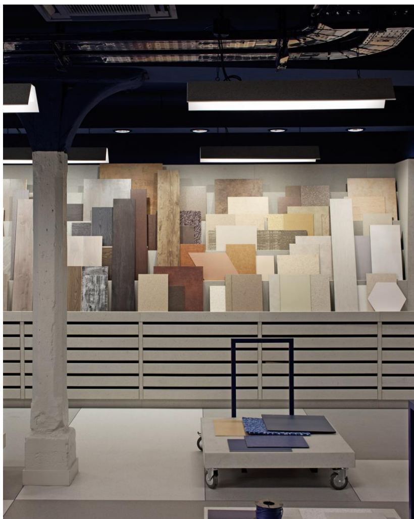
Chutes de revêtements de sols à l'Atelier Tarkett.