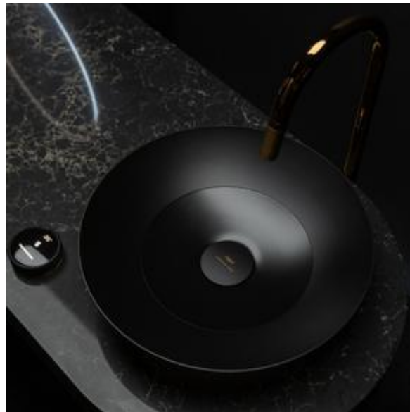
GROHE Collection Privée Vanity

La gamme GROHE SPA Atrio Collection Privée explore quant à elle la personnalisation à travers un travail raffiné sur les finitions et les matériaux. Grâce à sa collaboration avec le pionnier mondial Ceasarstone, la collection GROHE SPA Atrio intègre le quartz dans des designs proches de véritables pièces sculpturales.