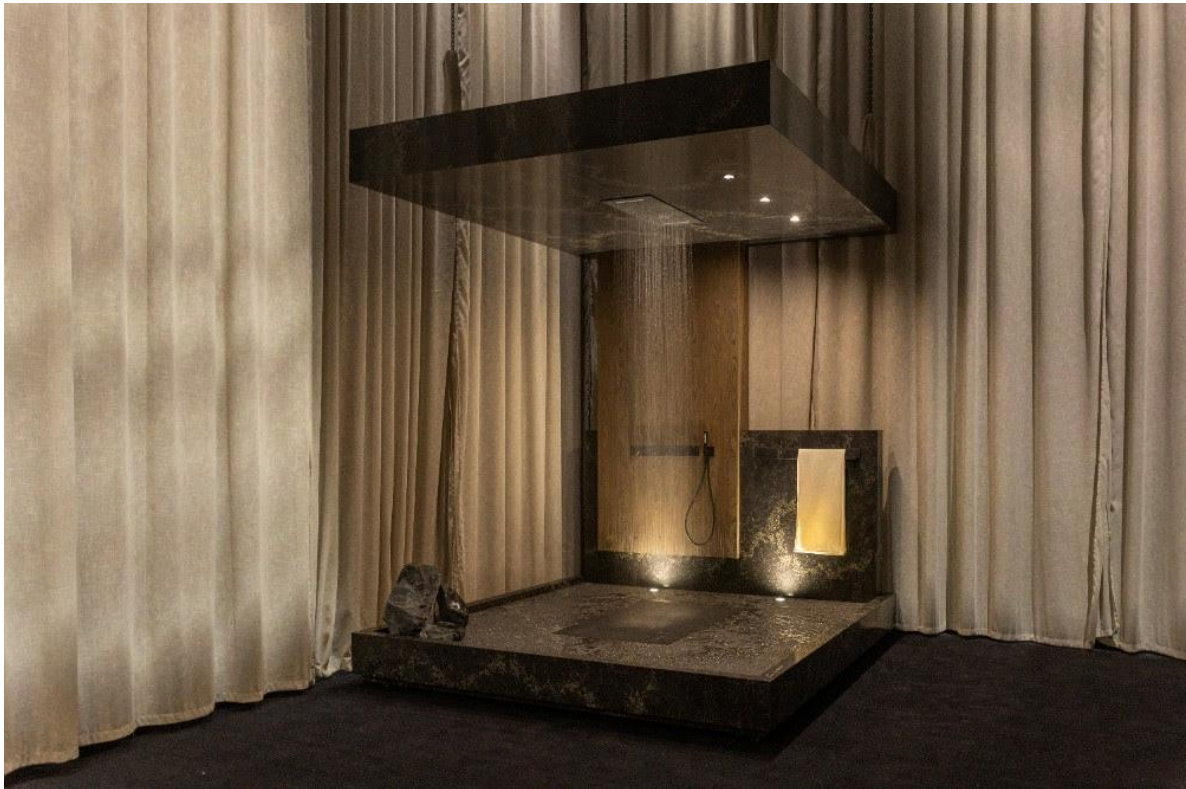
GROHE Allure Gravity

Avec la nouvelle collection de robinetterie GROHE Allure Gravity , GROHE pousse encore plus loin la personnalisation, grâce à des plaques interchangeable et des finitions sophistiquées comme les finitions Cordovan Leather ou Marine Teak ou encore des matériaux innovants et durables tels que Premial et Revia, sans oublier l'inspiration japonaise de la finition Kintsugi.