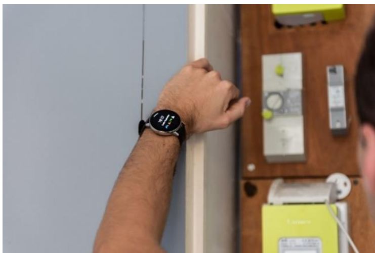
Technicien itinérant - Maintenance