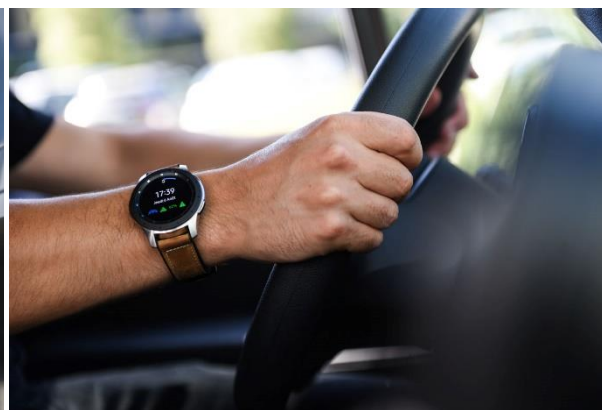
Livreur - Chauffeur