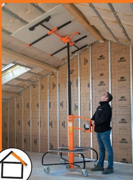
Pose sous rampants