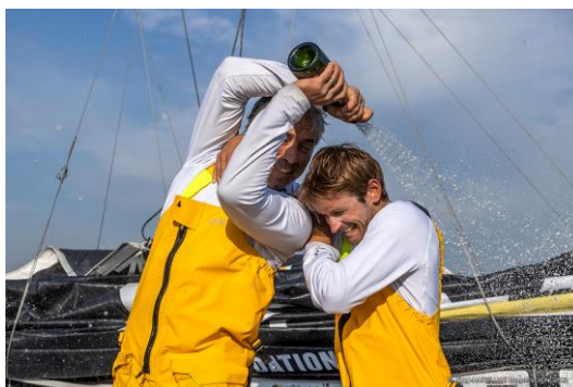
© Jean-Marie Liot | CIC Normandy Channel Race