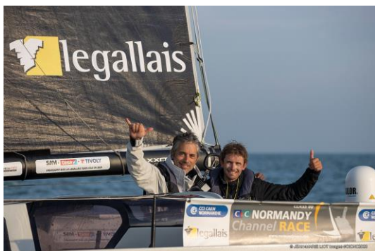
© Jean-Marie Liot | CIC Normandy Channel Race