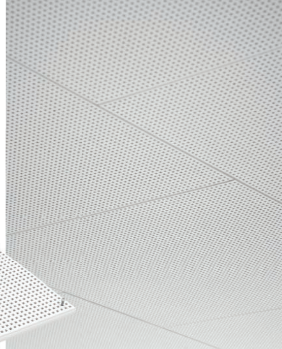
Pose à joint de pierre.