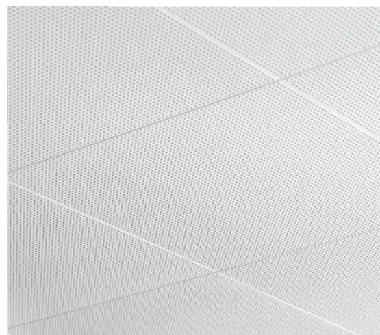
Pose à joint aligné.