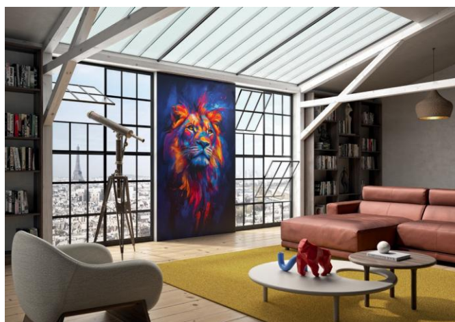
Le pouvoir esthétique Kinewall Design peut aussi sortir de la salle de bains pour habiller les autres pièces.

Prix public indicatif à partir de 306 euros HT le panneau de 202 x 100 cm.