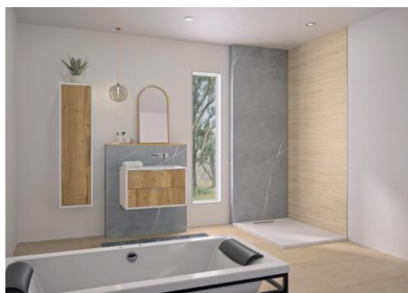
INTEGRA ESSENTIEL+ décor Marbre gris galet