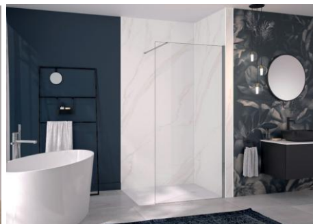
INTEGRA ESSENTIEL+ décor Marbre mordoré.

- INTEGRA DESIGN (panneau de fond en 3 décors possibles*, mitigeur thermostatique, barre de douche, douchette à main, étagère, flexibles d'alimentation - hauteur de 250 cm) ;