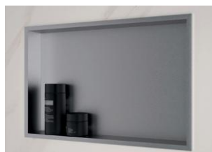
Zoom sur la niche de rangement INTEGRA Premium

* marbre gris galet, marbre mordoré et chêne antique.