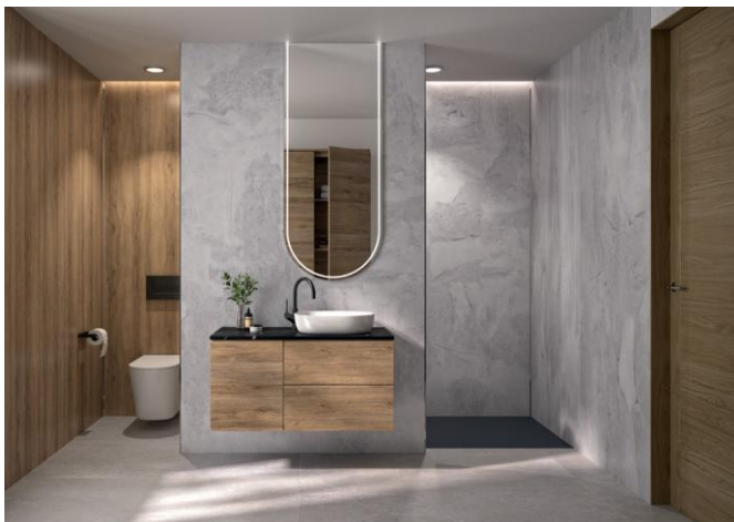
Nouveauté 2026, le décor Grey stone Kinewall Design