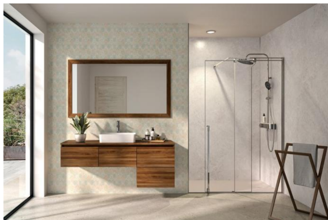
Kinewall Design décors Exotic (partie gauche) et Marbre nebbia (douche).