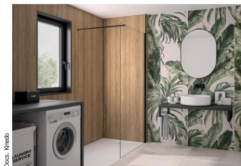
INTEGRA ESSENTIEL+ en décor Chêne antique.

Prix public indicatif à partir de 826 euros HT hors pose INTEGRA ESSENTIEL.