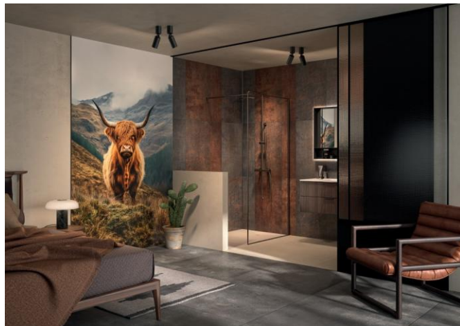
Kinewall Design offre la possibilité à l'envi de mixer les décors, comme ici, la nouveauté 2026 Highland à gauche et Métal stone pour la partie douche.

La collection 2026, riche de 73 décors, est marquée par l'arrivée de nouvelles références, au rang desquelles : Nuit fauve, Tangram, Paonara, Botanic terrazzo, Collines, Mandala, Métal stone, Highland, Grey stone, Royal folia, Piega oliva, Piega, Sporalis, Sporalis vert, Exotic ou encore Marbre nebbia.