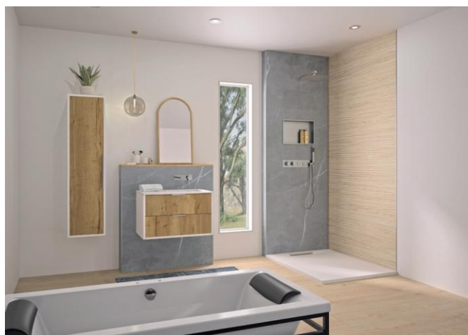
INTEGRA DESIGN en deux décors : Marbre gris et Galet.