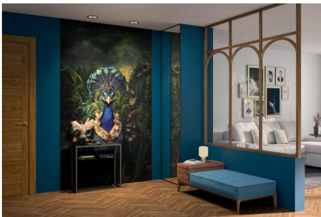
Kinewall Design décor Paonara, une nouveauté 2026 qui réhausse et habille cette entrée.