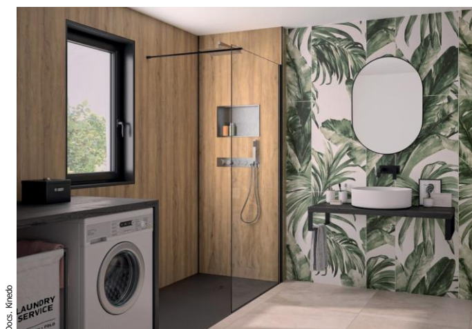
INTEGRA PREMIUM Chêne antique et sa niche de rangement intégrée.

- INTEGRA PREMIUM (panneau de fond en 3 décors possibles*, mitigeur thermostatique encastré avec boutons poussoirs, douchette à main, douche pluie, niche de rangement, le tout en inox brossé, flexibles d'alimentation - hauteur de 250 cm).