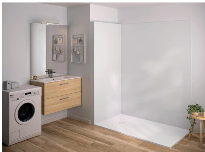
Ci-dessus, INTEGRA Essentiel.