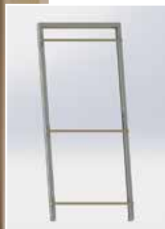
Huisserie écharpée (1 vantail)