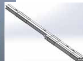
Huisserie bottelée (2 vantaux)

JELD-WEN prend un engagement fort et s'inscrit dans une démarche d'accompagnement des artisans et professionnels du bâtiment en leur proposant des solutions pour palier aux contraintes des chantiers.