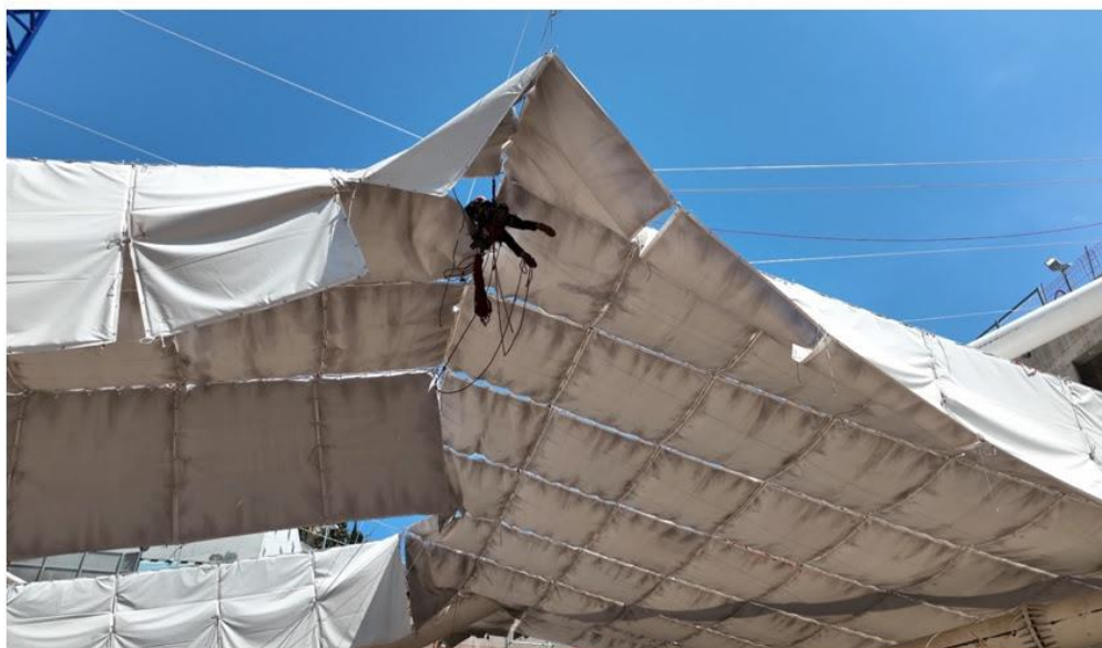
Pose de bâche acoustique sur le nouveau centre hospitalier Princesse Grace à Monaco

Paris, le 21 septembre 2022 - Jarnias, groupe français expert des travaux spéciaux et en hauteur, annonce une nouvelle prise de participation majoritaire - la quatrième depuis le début de l'année - dans le capital d'Acousteam, société qui propose des solutions innovantes pour lutter contre la pollution sonore. L'objectif pour le Groupe, leader des métiers sur cordes, est d'être la référence technique sur l'ensemble de métiers de la hauteur et de la protection en s'entourant des meilleurs experts dans leur domaine. En accompagnant l'accélération du développement de cette jeune entreprise, Jarnias souhaite participer à la dépollution sonore des villes.