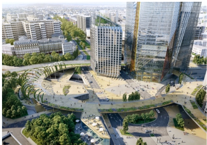
Au pied d'HEKLA, l'échangeur routier transformé en promenade piétonne végétalisée.

À l'initiative de l'aménageur public, Paris La Défense, le quartier, qui s'ouvre sur le centre-ville de Puteaux, aborde une nouvelle étape fondée sur la mixité des populations et une importance majeure offerte à la nature. Les lieux sont animés en journée comme en soirée. Aux côtés d'HEKLA, la résidence étudiante de 400 logements également dessinée par Jean Nouvel, faisait partie du même concours, lancé en 2012 par Paris La Défense et remporté par Hines et AG Real Estate.