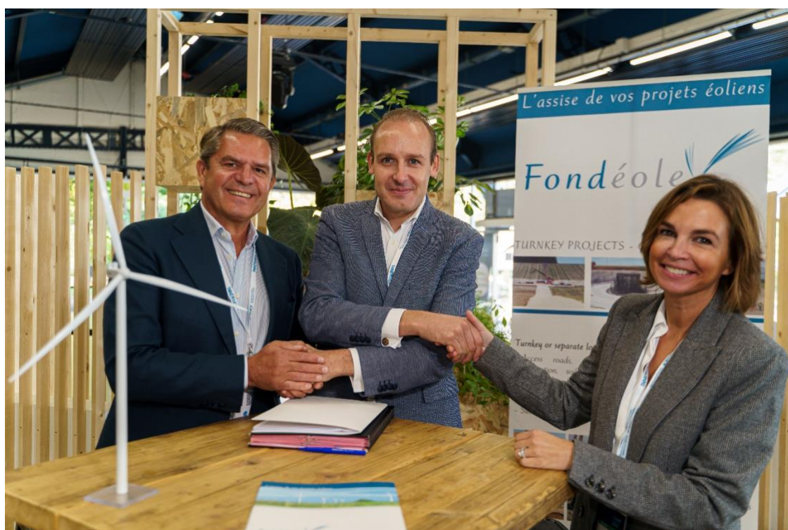
Les équipes de management de Hoffmann Green et du Groupe Fondéole

Acteur historique de l'éolien et constructeur de plus de 800 éoliennes au sein de 140 parcs depuis 2006, le Groupe Fondéole s'engage sur le terrain à utiliser et à promouvoir les ciments Hoffmann auprès de l'ensemble des acteurs français du secteur. Hoffmann Green et le Groupe Fondéole ont pour ambition de construire 50% des fondations d'éoliennes onshore et offshore en ciments Hoffmann à horizon 2028, ce qui représente environ 50 000 tonnes de ciments.