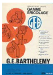
Affiche commerciale des premiers produits GEB vendus en quincaillerie (1945)