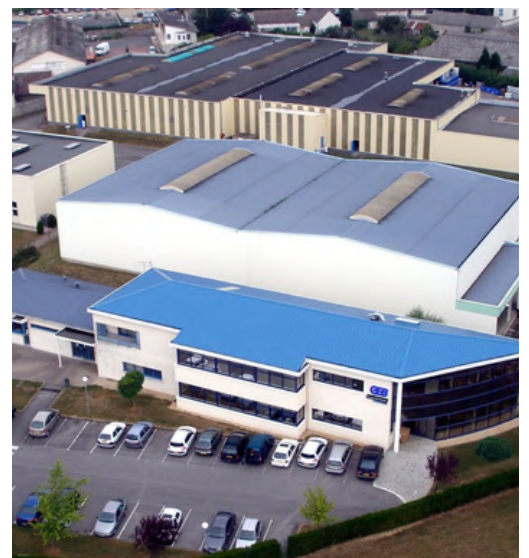
Site industriel de Nanteuil-le-Haudouin (60) comprenant 59 salariés répartis sur 32 000m 2

L'entreprise investit dans la formation et le développement des compétences, tant sur les dimensions techniques que sur les enjeux de qualité, de sécurité et de RSE.