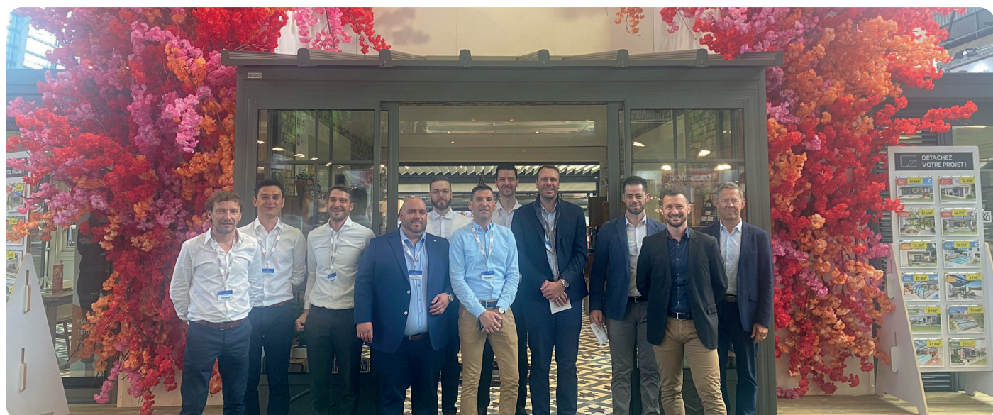
L'équipe commerciale Gustave Rideau en place à la Foire de Paris 2023. Les produits de la marque sont, cette année, embellis par une décoration de façade fleurie et colorée signée par l'artiste fleuriste Luc Deschamps.