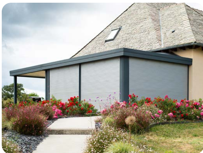
En été, la véranda Wallis&Energy bloque les apports solaires pour éviter une chaleur excessive.

Précisons qu'un remplissage photovoltaïque sur la moitié de la surface de la toiture présente l'avantage de produire de l'électricité délocalisée et verte, revendue à son fournisseur d'énergie. L'autre moitié bénéficie d'un remplissage vitré pour optimiser les apports de chaleur en saison froide. Une véritable démarche écologique qui s'inscrit pleinement dans la transition vers une énergie plus propre et durable, érigeant Wallis&Energy® en solution d'avenir.