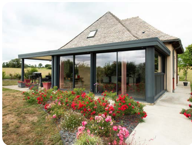
La véranda intelligente bioclimatique Wallis&Energy de Profils Systèmes s'impose par ses nombreuses performances synonymes de confort et d'économies d'énergie en toute saison.

La véranda bioclimatique Wallis&Energy® garantit une température intérieure, comme celle de la maison où elle est accolée, maintenue entre 19 et 28° C. En période hivernale, les ouvertures s'adaptent parfaitement afin de bénéficier de la chaleur du soleil en la transférant efficacement dans la maison, contribuant à diminuer drastiquement la consommation de chauffage.