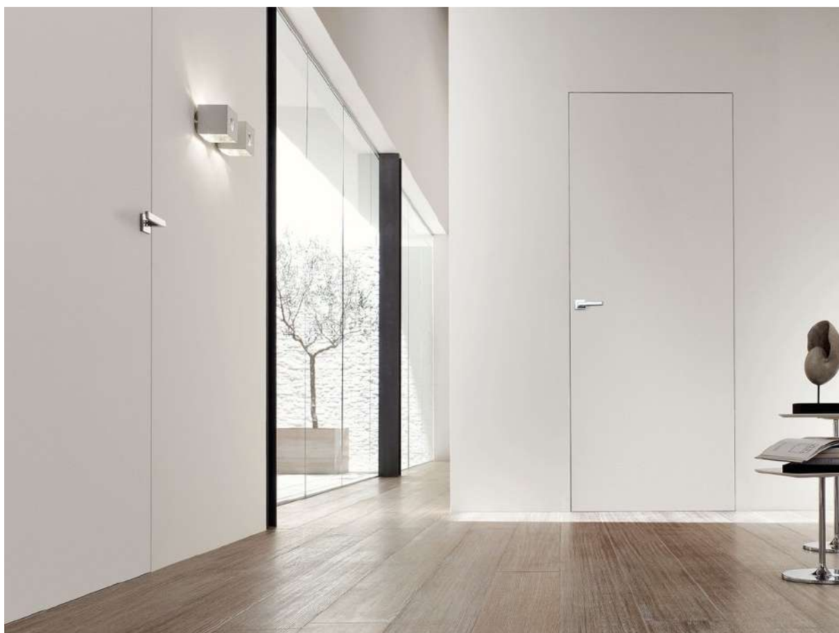
Syntesis®Battant - Ambiance porte bois blanc

Syntesis® Battant doit être complétée par un panneau de porte et une boîte de quincaillerie. La porte est disponible en finition bois brut à peindre, laqué ou verre & aluminium. Quel que soit votre choix, ces portes raffinées transformeront vos pièces. Complétée par les supports de plinthe Syntesis®, la cloison est lissée du sol au plafond.