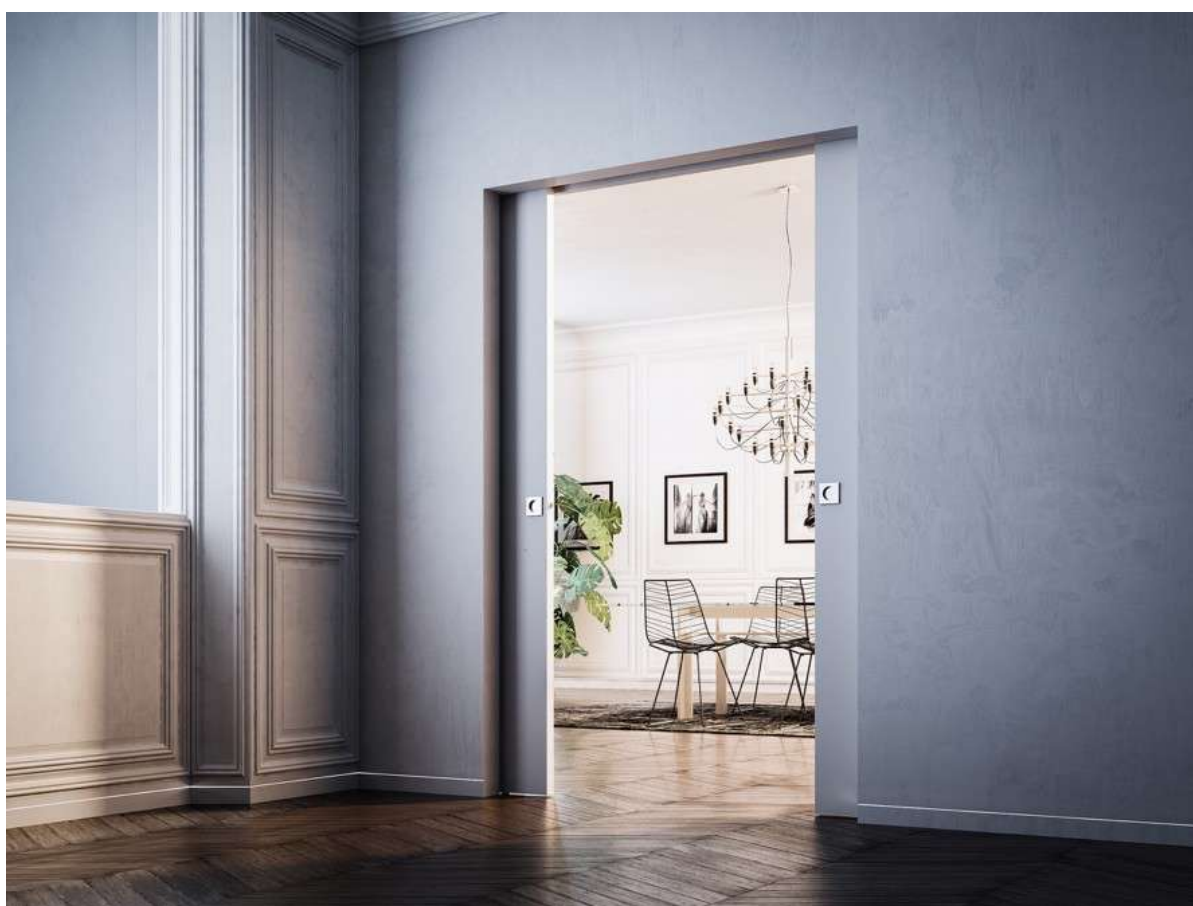
Syntesis® Line Extension - Porte bois

Le châssis Syntesis® Line Extension est en osmose avec vos cloisons. Les portes coulissantes disparaissent dans les coffres. En le combinant avec les supports de plinthes Syntesis®, vos murs deviennent lisses du sol au plafond.