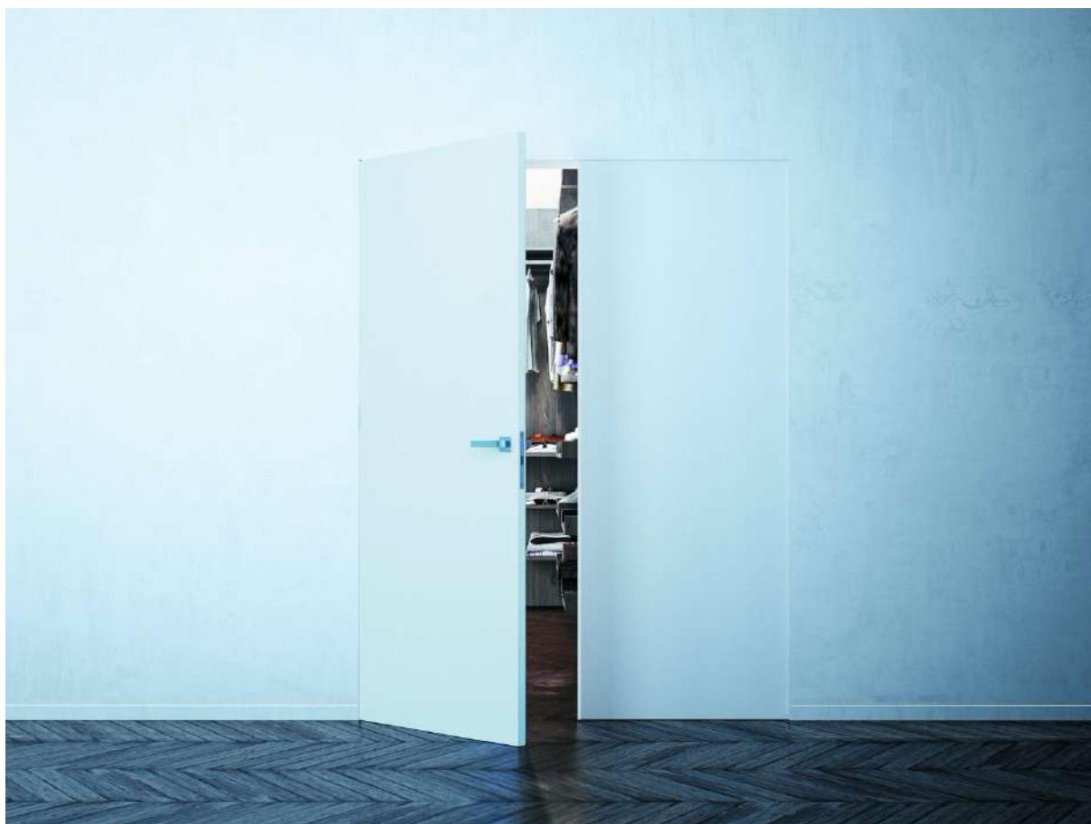
Syntesis® Battant Extension - Portes âme pleine

L'huisserie est conçue pour éviter toute surépaisseur entre les portes et la cloison qui reste parfaitement lisse. Au lieu de revêtir ses angles d'un habillage en bois, il suffit d'enduire les profils de mortier adhésif pour réaliser un angle résistant qui ne fissure pas. Les portes sont équipées de charnières invisibles pour se fondre dans les murs.