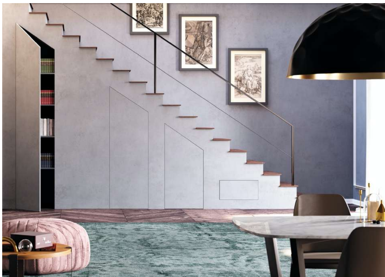
Syntesis® Areo - Version un vantail à soufflet et inclinée

Sa spécificité à fleur de cloison, ses charnières invisibles et son panneau prêt à peindre ou à tapisser, en font une porte discrète et ingénieuse entièrement dissimulée dans la cloison. Résultat : un placard élégant et insoupçonné qui devient un élément architectural esthétique pour dissimuler les rangements de la vie quotidienne.