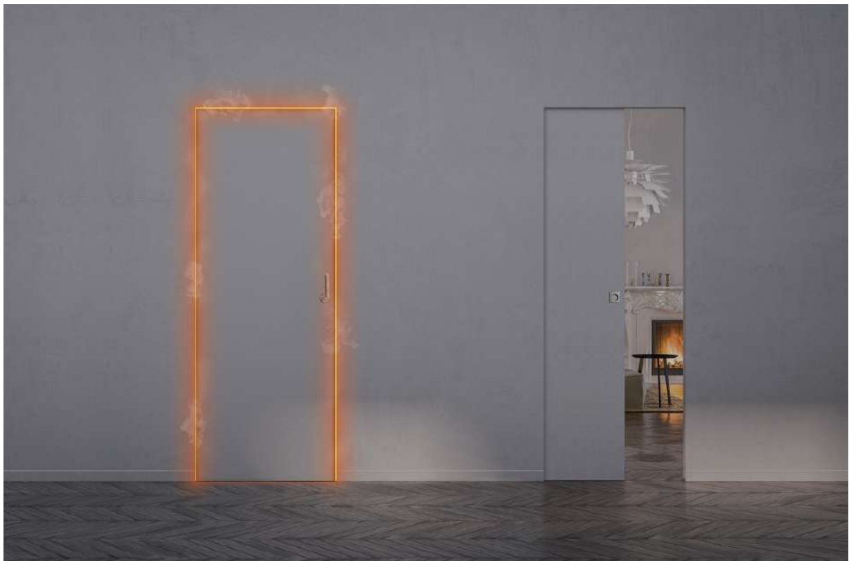
Syntesis® EI30 - Version battante (à gauche) et coulissante (à droite)

La porte battante permet d'obtenir des performances techniques sans renoncer au style minimaliste de la collection Syntesis®. Elle est conforme aux normes EN1363.1 et EN1634, et certifié par le PV n°ERF-16-003318.