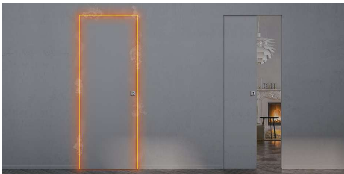
Syntesis® Line EI30 - Bois âme pleine à galandage

La porte coulissante Syntesis® Line EI30 bloque le passage de la fumée et empêche la propagation des flammes pendant au moins 30 minutes, conforme aux normes EN1363.1 et EN1634, et certifié par le PV n°ERF-15-V-003628. Sans habillage, ni couvre-joints, Syntesis® Line EI30 permet d'obtenir des performances techniques sans renoncer au style minimaliste de la collection Syntesis®.