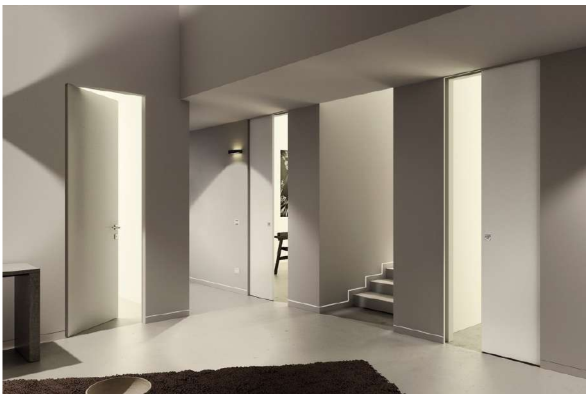
Syntesis® Collection - Ambiance porte bois blanc

Au fil des années, ECLISSE a étoffé cette gamme avec de nouveaux produits tels que la Syntesis® Acoustique et la Syntesis® Areo. Aujourd'hui la marque propose une gamme complète qui s'adapte à tous les projets d'intérieur.