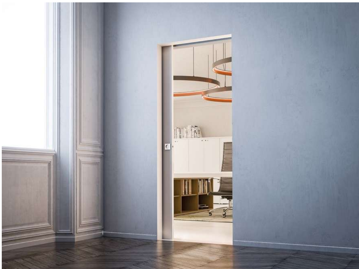
Syntesis® Line - Porte bois

Syntesis® Line est la porte coulissante à galandage qui disparaît dans la cloison grâce à l'absence d'habillage autour de la porte. Le châssis permet une excellente qualité de finition grâce à ses montants renforcés. Rien n'arrête le regard : ni habillage, ni couvre-joint.