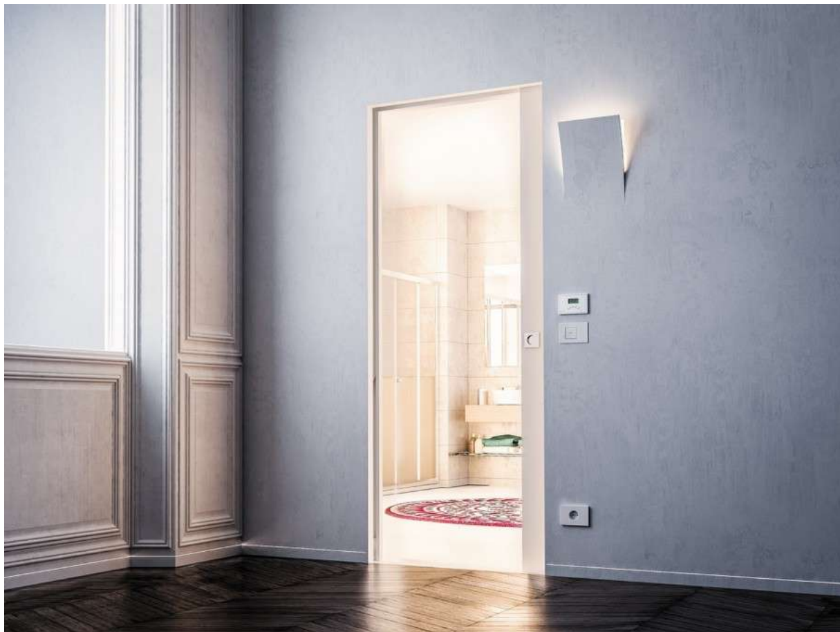
Syntesis® Luce - Porte bois blanc

Le châssis est équipé d'une gaine spéciale pour accueillir le câblage des interrupteurs, prises, thermostats ou appliques lumineuses. Plus besoin de modifier votre implantation électrique à cause de la porte.