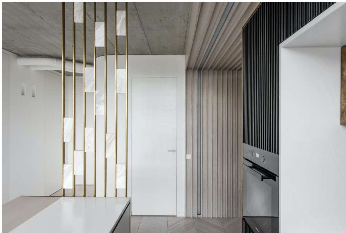
Syntesis® Battant Acoustique - Ambiance porte bois blanc

Avec Syntesis® Battant Acoustique, ECLISSE répond tant aux exigences esthétiques qu'aux problématiques de bruit à l'intérieur de l'habitat. Selon le besoin d'affaiblissement sonore, la porte est proposée en deux versions acoustiques : 30 dB ou 34 dB.