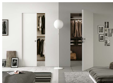
Syntesis® Line et Syntesis® Battant - Porte bois

Le nouveau catalogue est déjà utilisé par les commerciaux lors de leurs rendez-vous clients. Ils présentent ainsi l'ensemble des produits de la gamme ECLISSE à travers de beaux visuels. Les professionnels peuvent également contacter leur commercial afin de recevoir un exemplaire de celui-ci.