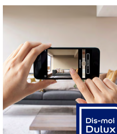
Sélection des couleurs avec l’application Visualizer

Exit les blocages et les hésitations. On apprend à mixer les styles et faire twister les gammes et les tendances n’a jamais été aussi facile. “Dis-moi Dulux Valentine” c’est le partenaire privilégié et fiable qui répond à toutes les questions que l’on se pose dans la vraie vie. Tuto, coaching, facile de bénéficier d’un vrai accompagnement pour réaliser un projet de décoration, même le plus fou.