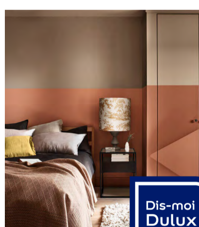
Coaching déco sur mesure

Ultra pratique, “Dis-moi Dulux Valentine” concentre tous les outils possibles pour jouer au parfait architecte d’intérieur. Idéal pour se simplifier la vie en un clic.