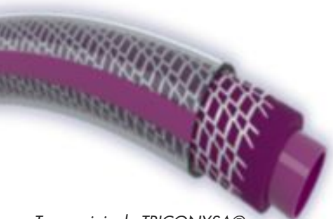
Tuyau vinicole TRICONYSA®

Dans le domaine agricole, par exemple, TRICOGREEN® s'inscrit dans cette logique d'économie circulaire. Conçu pour les usages d'irrigation et de transfert de fluides, ce tuyau intègre 80 % de PVC recyclé dans sa composition, tout en conservant des performances d'usage équivalentes à celles du TRICOFLEX® standard. Il illustre parfaitement la capacité de l'entreprise à intégrer des matériaux recyclés sans compromis sur la fiabilité et la robustesse attendues dans des environnements exigeants.