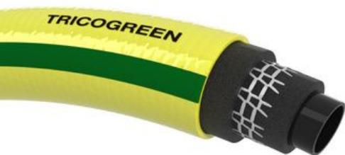
Tuyau éco-conçu TRICOGREEN®

Plusieurs développements récents illustrent concrètement cette approche.