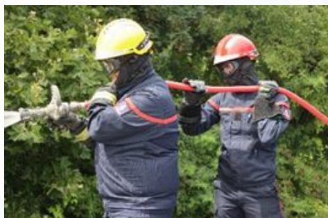
Tuyau semi-rigide pour camions de pompiers T 1947

Les tuyaux destinés à la lutte contre l'incendie répondent à des exigences de résistance à la pression et de conformité normative où la sécurité des personnes est directement en jeu.