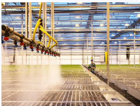
Tuyau éco-conçu TRICOGREEN

TRICOFLEX conçoit des solutions qui assurent l'irrigation, le transfert de fluides et la pulvérisation dans des conditions d'usages extrêmes (exposition aux intempéries, variations thermiques, sollicitations mécaniques répétées, contact avec des produits phytosanitaires ou des engrais liquides).