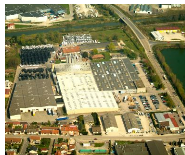
Site industriel de TRICOFLEX à Vitry-le-François (51)

L'histoire de TRICOFLEX débute en 1957 à Vitry-le-François, dans la Marne. Dès ses origines, cette PME industrielle française se spécialise dans la conception et la fabrication de tuyaux techniques en PVC, posant les fondations d'un savoir-faire qui ne cessera de se renforcer au fil des décennies.