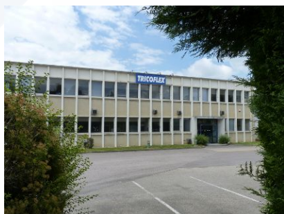
Sitège de TRICOFLEX à Vitry-le-François (51)

Au tournant des années 2000, l'entreprise élargit son périmètre produit sous l'ère Hozelock TRICOFLEX, avec notamment le lancement en 2004 du PROFILINE®, un tuyau certifié pour le transfert d'eau potable. C'est en 2012 que TRICOFLEX entre dans une nouvelle phase de son histoire en intégrant le Groupe EXEL Industries, industriel familial français spécialisé dans la conception et la fabrication d'équipements industriels et agricoles, présent en Europe, en Amérique et en Asie. L'entreprise dispose ainsi des moyens nécessaires pour investir dans la modernisation de son outil industriel, dans la recherche de nouvelles formulations et dans le développement de solutions adaptées aux évolutions de ses marchés.