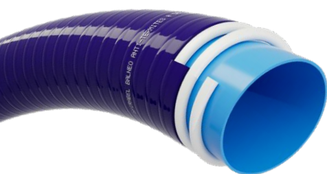
Tuyau spiralé renforcé SPIRABEL® BALNÉO ANTI-TERMITES

Enfin, le SPIRABEL® BALNÉO ANTI-TERMITES, apporte une réponse concrète à une problématique terrain rencontrée dans certaines zones géographiques particulièrement exposées aux infestations. Ce tuyau intègre une protection anti-termites directement dans la masse du PVC, garantie 12 ans. Cette innovation permet de limiter les risques de dégradation prématurée des installations enterrées de piscines et de balnéothérapie et d'éviter des dysfonctionnements coûteux pour les utilisateurs.