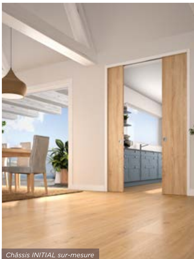
Châssis INITIAL sur-mesure

DEYA est aujourd'hui la marque française offrant le plus large panel de solutions dédiées aux activités du second œuvre du bâtiment. 1 logement sur 5 est équipé d'un produit DEYA. Le groupe se démarque par une volonté affirmée de conserver une production 100% française et de développer un service d'innovation qui anticipe chaque problématique industrielle.