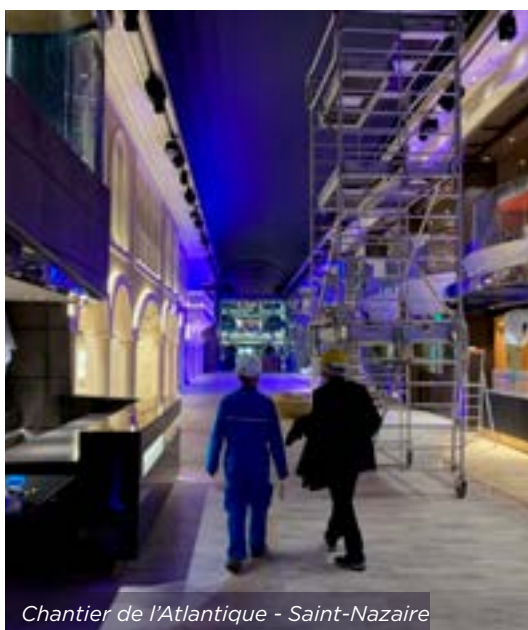
Chantier de l'Atlantique - Saint-Nazaire