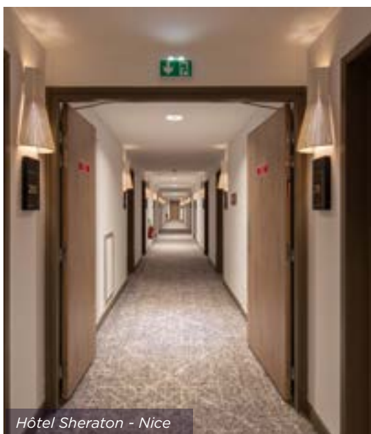
Hôtel Sheraton - Nice