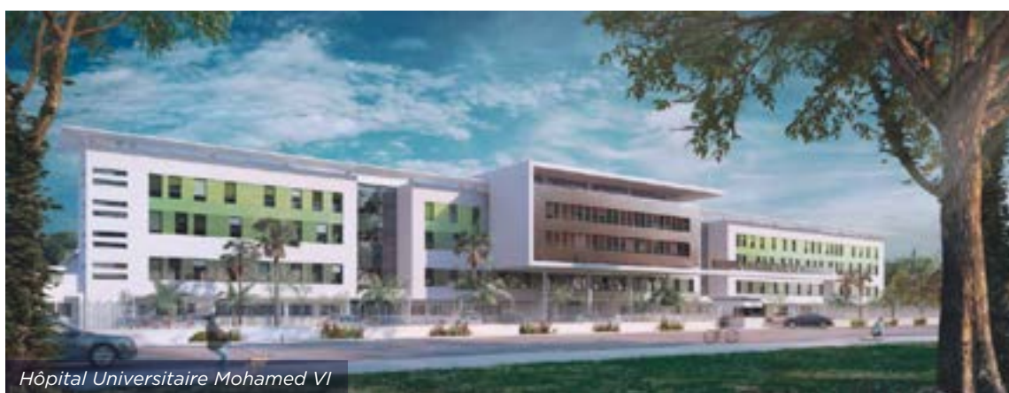
Hôpital Universitaire Mohamed VI