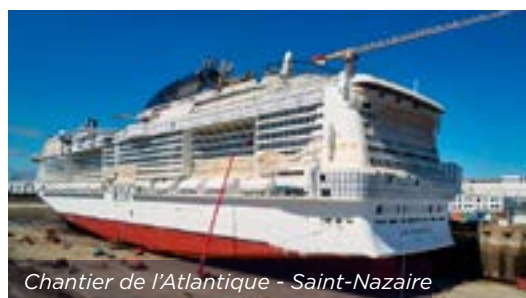
Chantier de l'Atlantique - Saint-Nazaire

Chantier réalisé par MEDIA 6 / PAUL CHAMPS / GANTER pour MSC croisière. Bateau de 331 m de long avec 20 tonnes de montant ID 4 48.