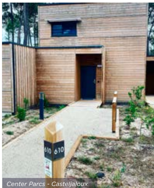
Center Parcs - Casteljalous