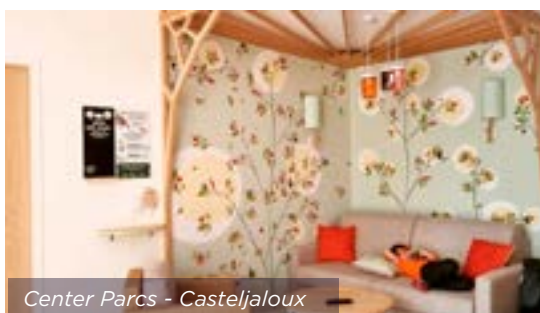
Center Parcs - Casteljalous

380 cottages avec 380 portes d'entrée PAC DAMAS posées par l'entreprise SYBOIS (filiale du fabricant de menuiserie extérieure Millet à Bressuire) et 2500 blocs-portes Ame pleine, stratifiés sur huisserie bois sapin BLOCFER posés par notre client CESA.