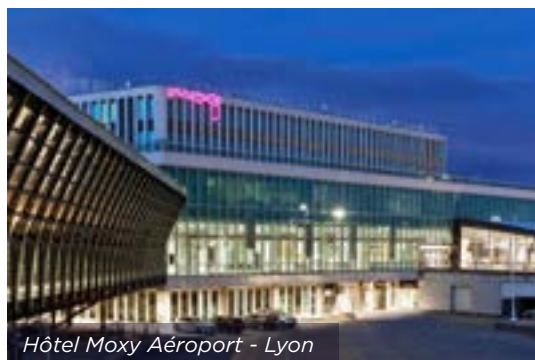
Hôtel Moxy Aéroport - Lyon