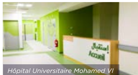
Hôpital Universitaire Mohamed VI

Chantier réalisé avec Bouygues construction international en 2019/2020. 800 000 € de blocs-portes techniques fabriqués par BLOCFER et huisseries métalliques EDAC.