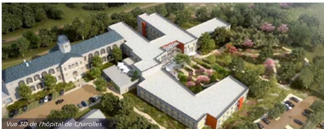
Vue 3D de l'hôpital de Charolles

Réalisé par la société SMPP (Société Montchaninoise de Plâtrerie Peinture) avec le client DORAS (agence du Creusot 71). Avec 30 tonnes d'ossatures métalliques montant 62.