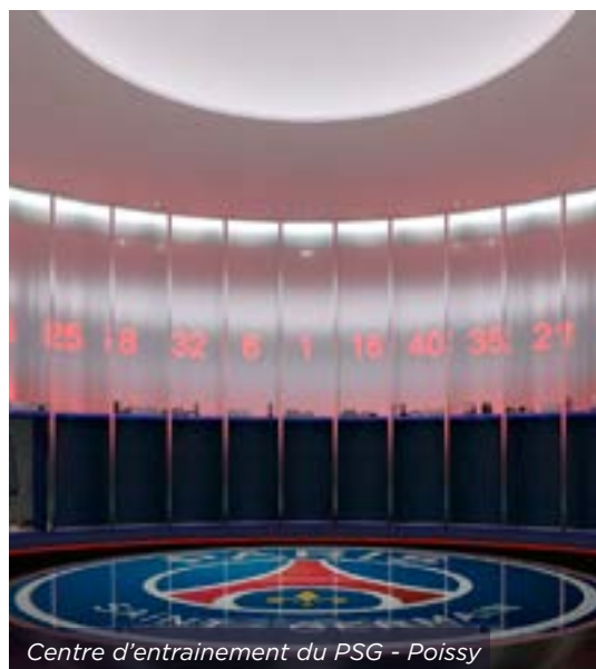
Centre d'entraînement du PSG - Poissy

Construction du Training Center, nouveau centre d'entraînement de l'équipe de foot du PSG, ce domaine s'étend sur 74 hectares et devrait être terminé vers juin 2023. Le futur bâtiment destiné aux professionnels sera de 4 étages et aura une surface de 10 000 m 2 . Ce chantier est réalisé en partie par la société DECO CLOISON via le négoce SDC avec des ossatures métalliques (montants de 36, 48, 70 et 90) et cornières plafonds 34/23 pour SPP et des accessoires acoustiques et de finitions pour PAI.