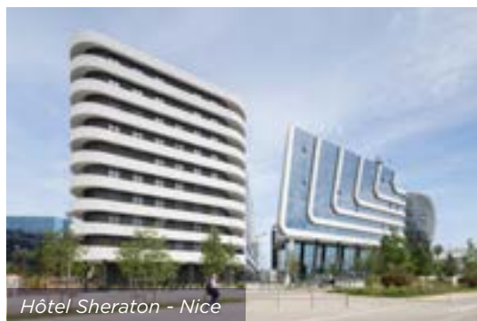
Hôtel Sheraton - Nice