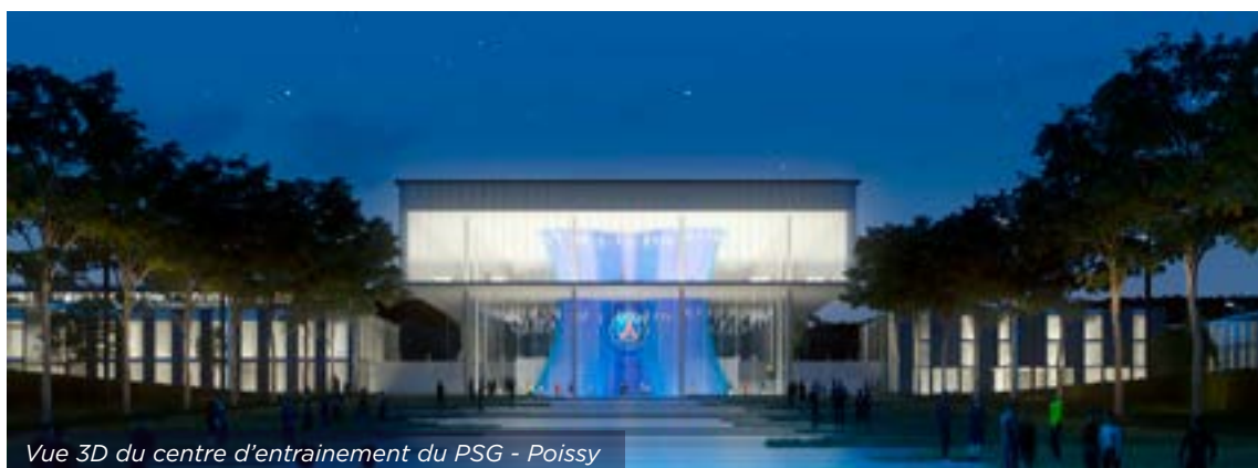
Vue 3D du centre d'entraînement du PSG - Poissy