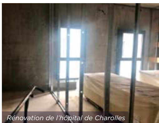
Rénovation de l'hôpital de Charolles