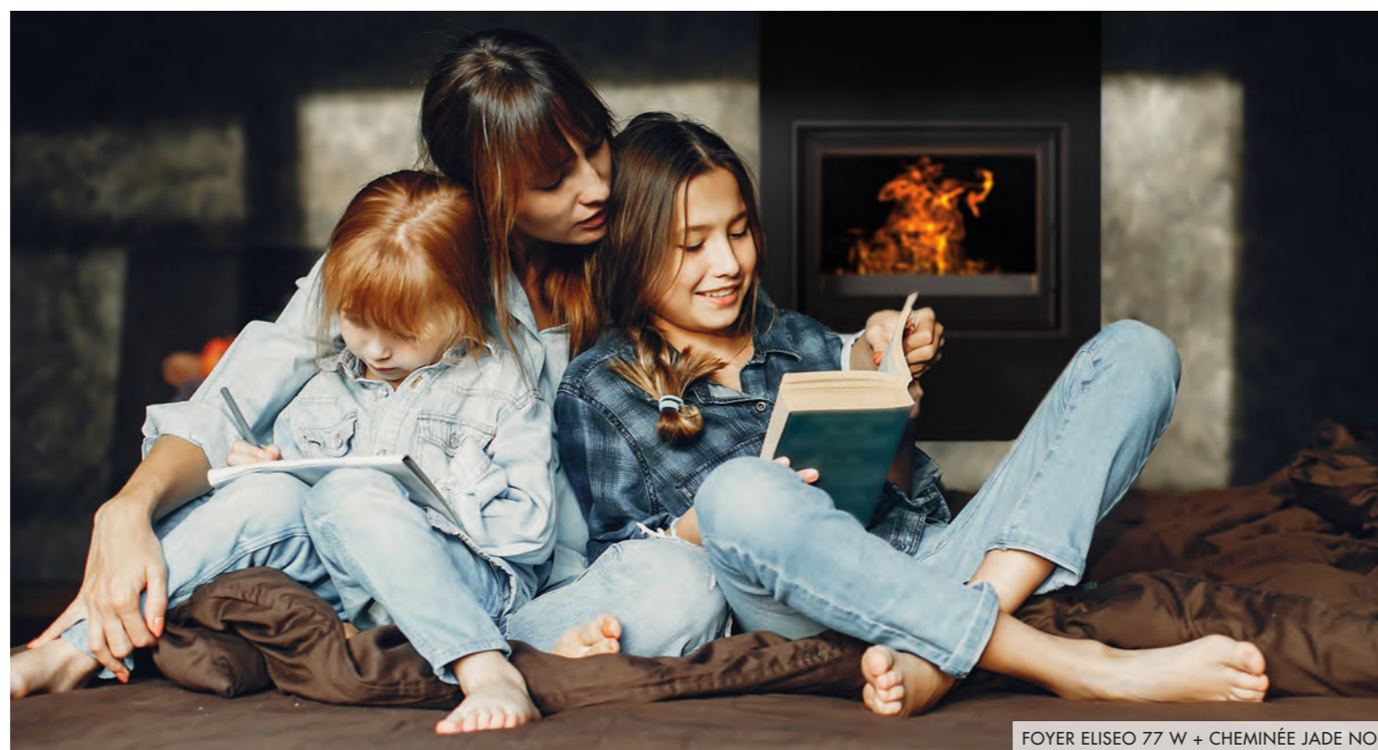
FOYER ELISEO 77 W + CHEMINÉE JADE NOIR

Toujours à l'écoute des tendances et en réponse au défi climatique qui nous attend, TURBO FONTE a décidé de valoriser le stock dormant de plus de 3 000 pièces détachées existant en proposant le premier service de reconditionnement des poêles qui a pour vocation à largement se développer.