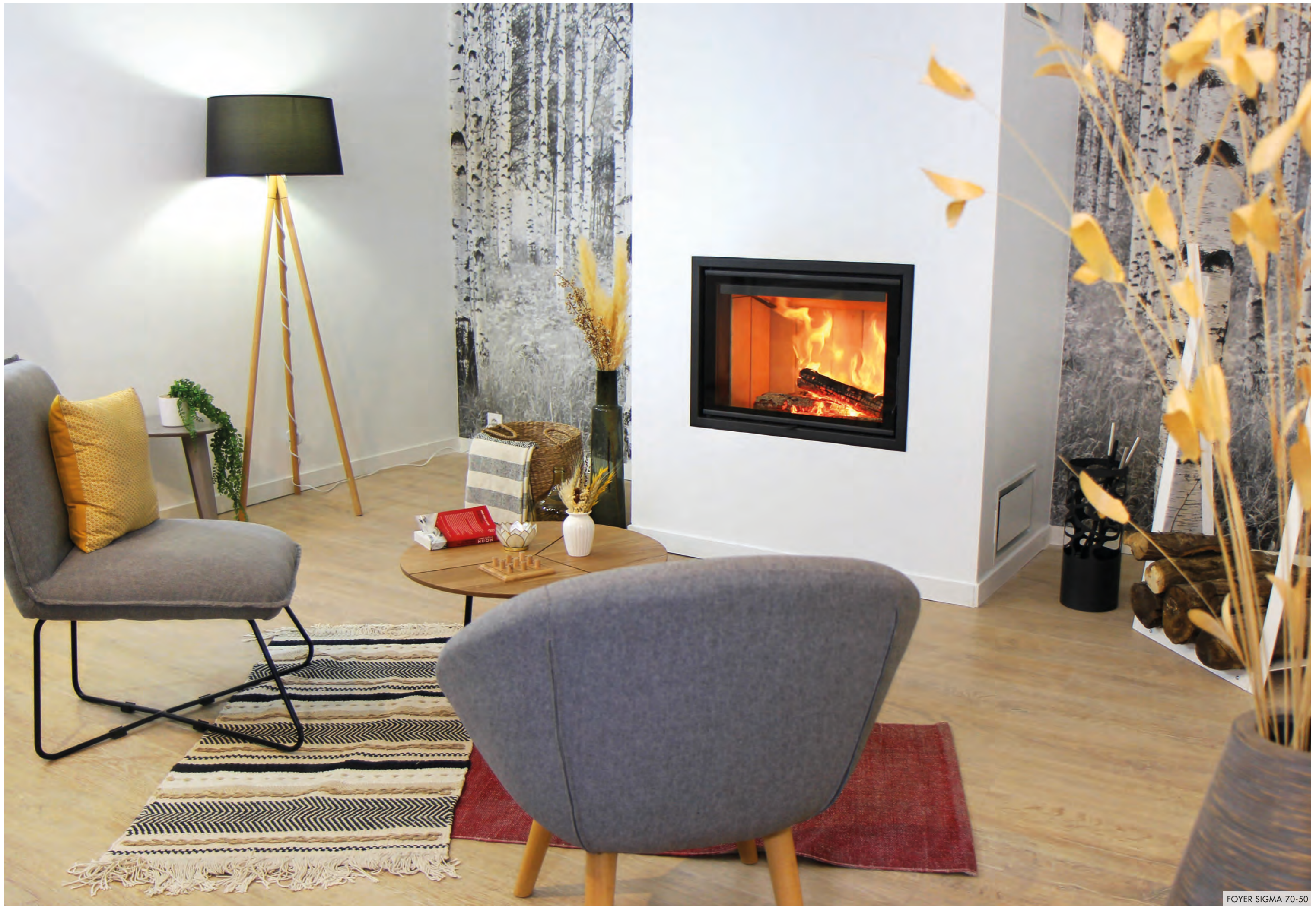
FOYER SIGMA 70-50