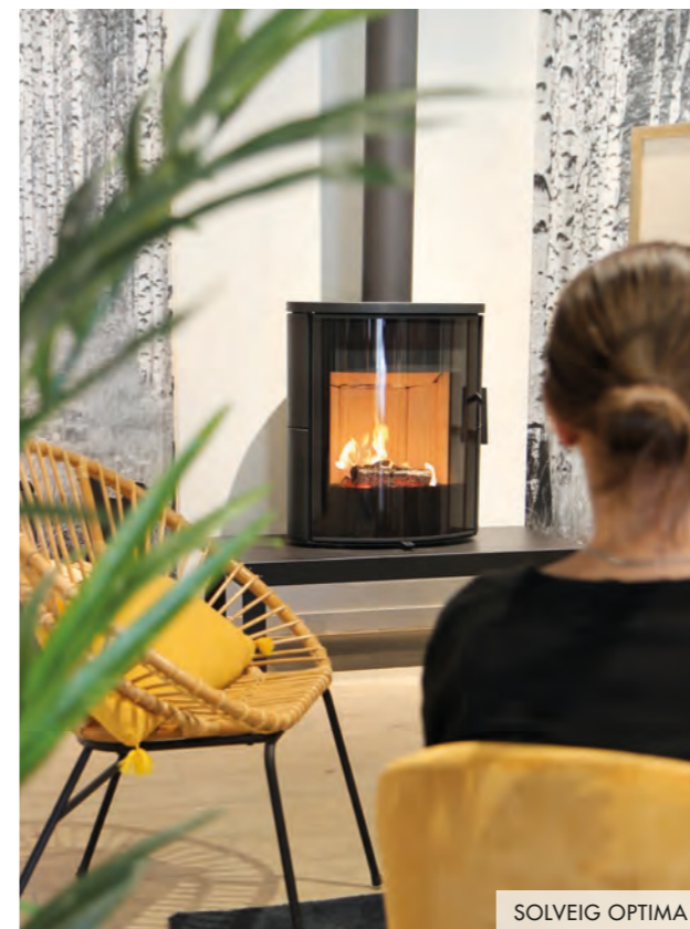
SOLVEIG OPTIMA S

Déjà près de 40 ans que la marque familiale conçoit et commercialise des solutions de chauffage qui allie design & technologie . Sa priorité est de proposer chaque année de nouveaux modèles qui répondent aux envies des clients en quête d'une belle expérience esthétique et d'une solution de chauffage efficace et écologique .