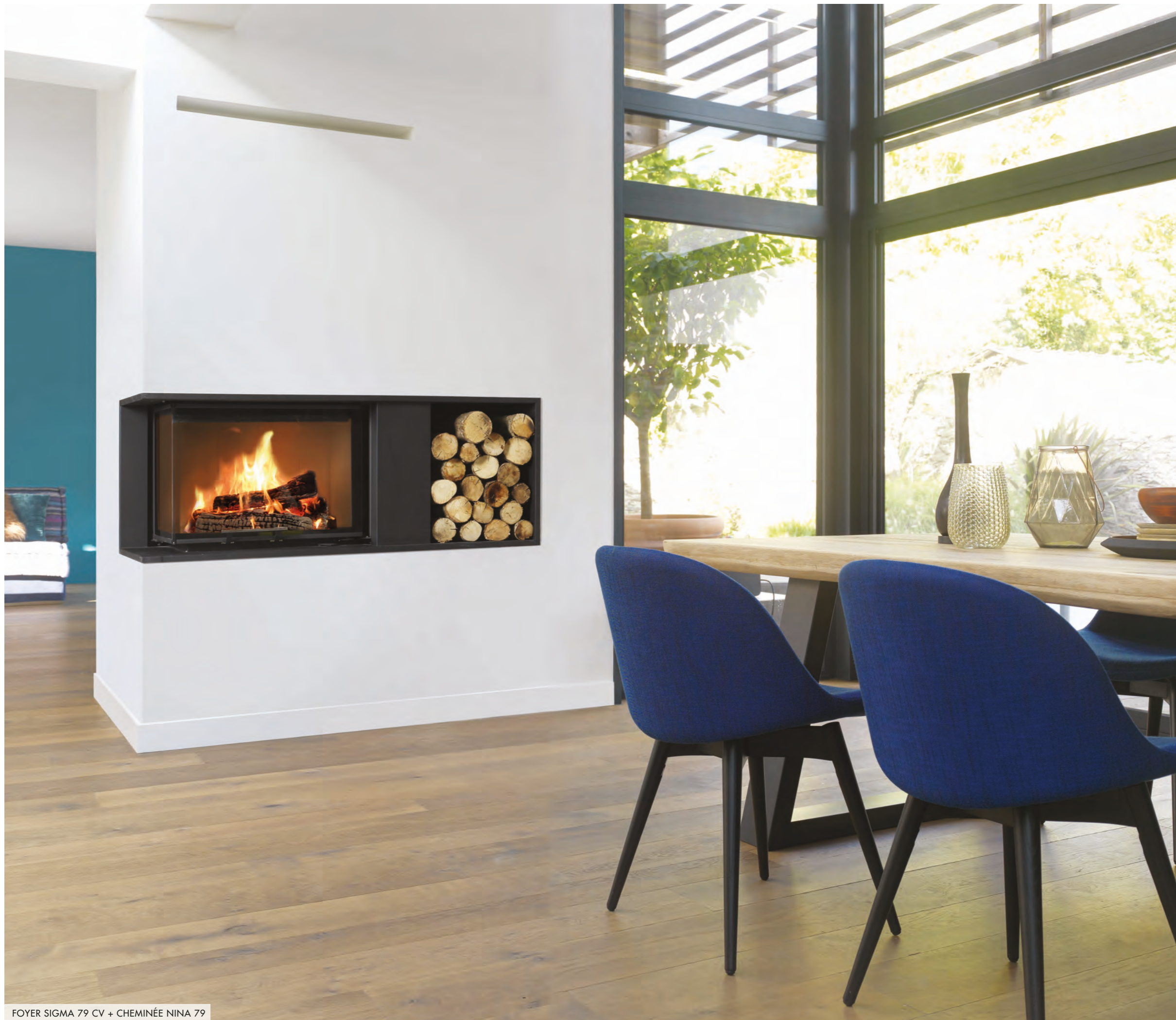
FOYER SIGMA 79 CV + CHEMINÉE NINA 79