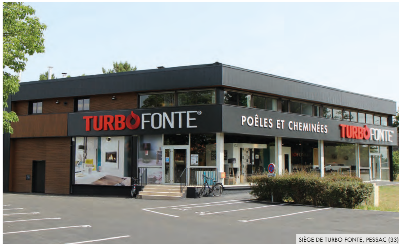
SIÈGE DE TURBO FONTE, PESSAC (33)