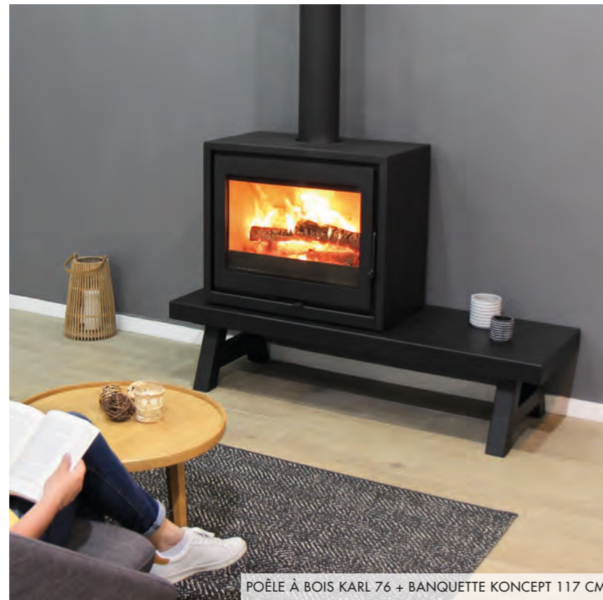
POÊLE À BOIS KARL 76 + BANQUETTE KONCEPT 117 CM

⊕ Prix variable selon la personnalisation choisie De 524,40 € à 1 194 € TTC