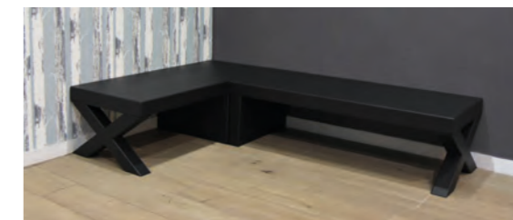
BANQUETTE KONCEPT 150 CM + 117 CM