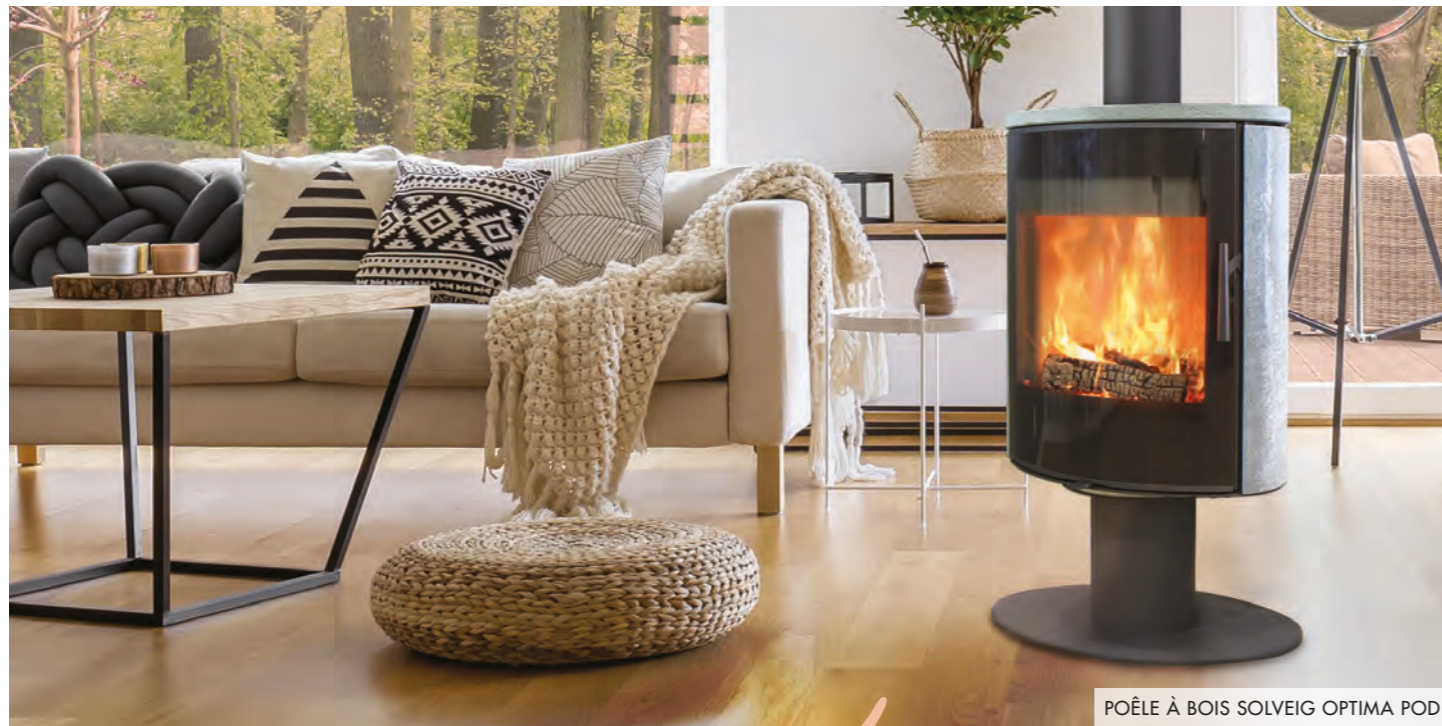
POÈLE À BOIS SOLVEIG OPTIMA POD