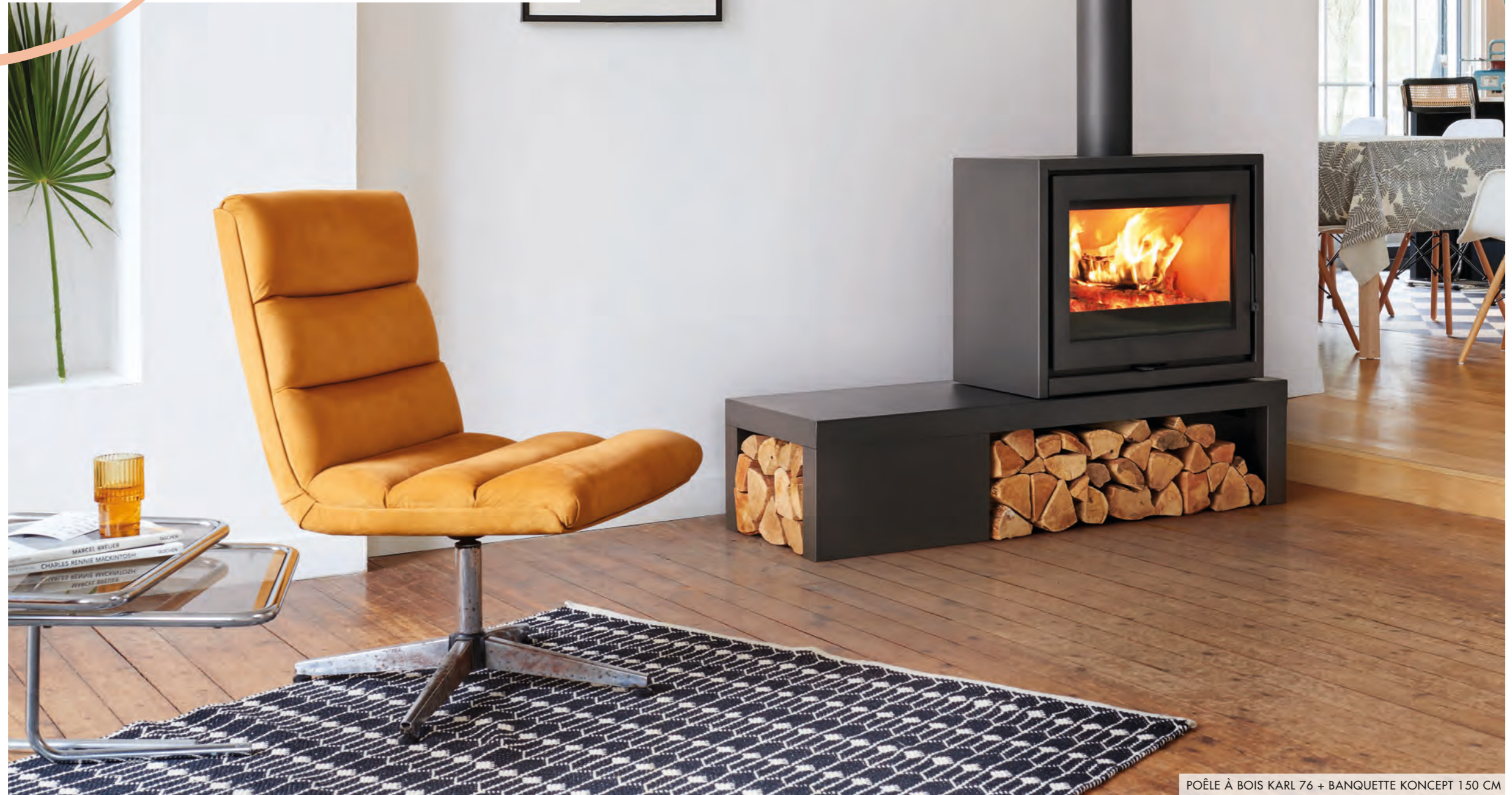
POÈLE À BOIS KARL 76 + BANQUETTE KONCEPT 150 CM