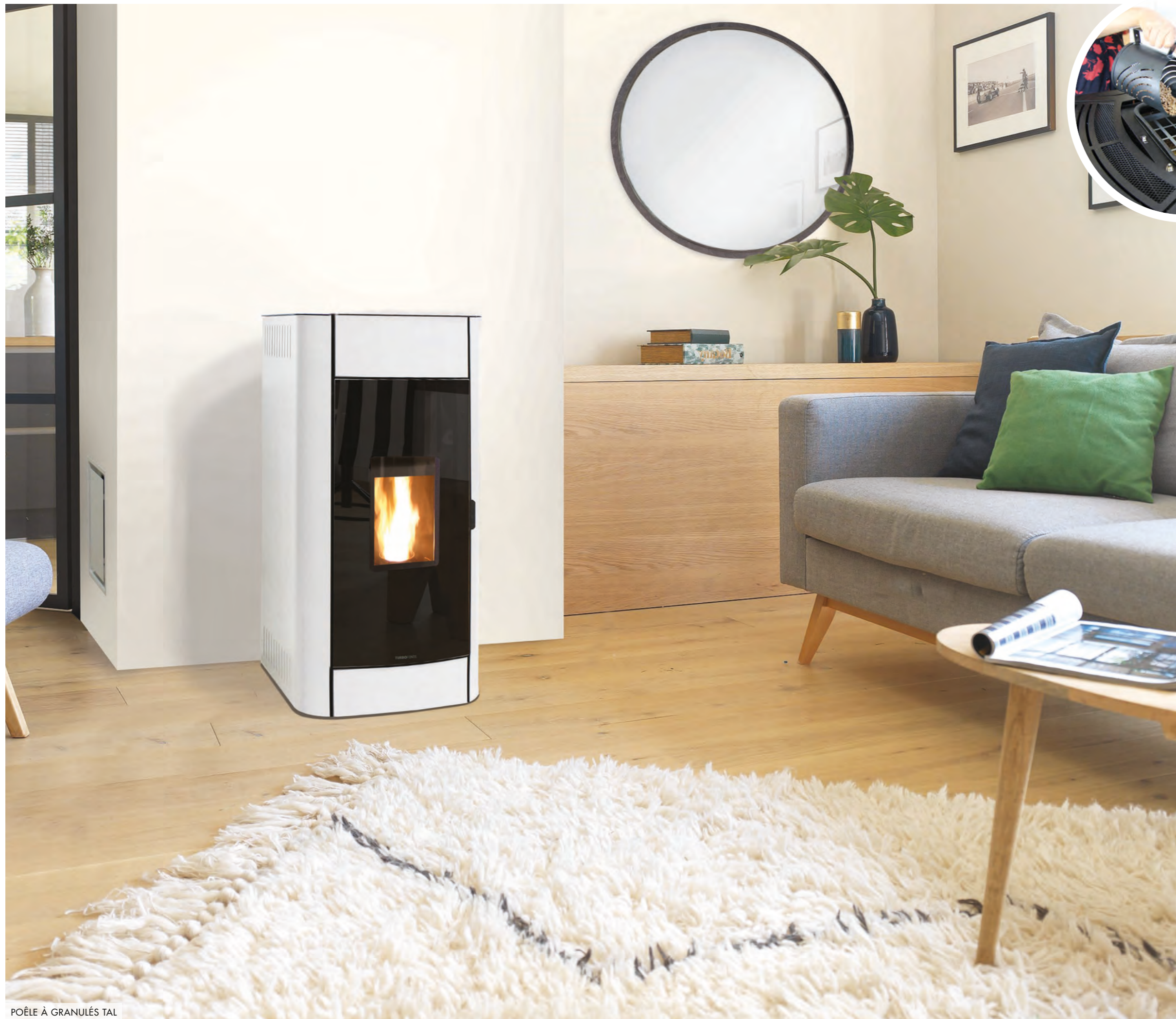
POÊLE À GRANULÉS TAL