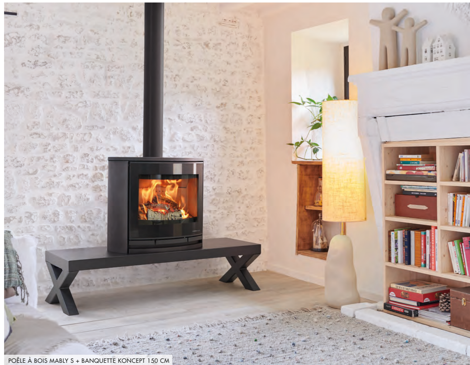
POÊLE À BOIS MABLY S + BANQUETTE KONCEPT 150 CM