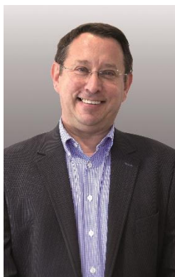
Président du Jury des Trophées des artisans du Patrimoine et de l'Environnement Président CAPEB Auvergne-Rhône-Alpes