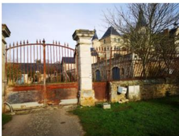
Etat du chantier avant travaux