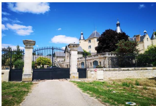
Pose des grilles et du portail