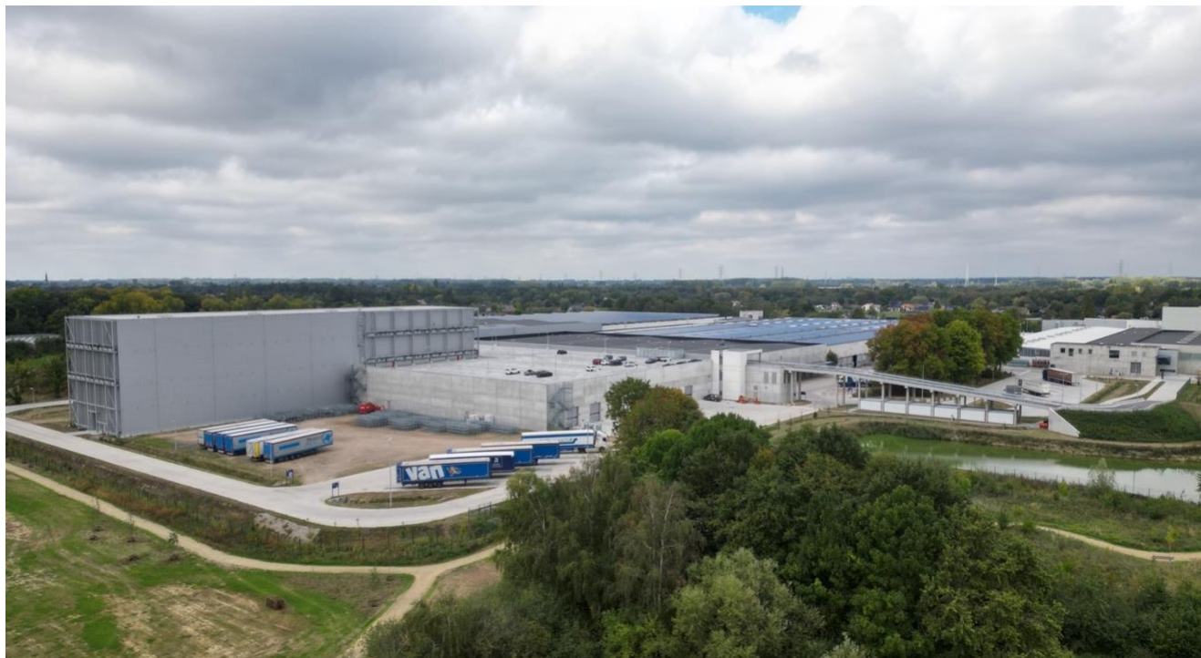
Campus Reynaers à Duffel (Belgique) – Une organisation intégrée sur une surface de 108 000m 2 .

Née en 1965, le groupe familial Reynaers est devenu en six décennies un acteur mondial de premier plan des solutions en aluminium pour l'enveloppe extérieure du bâtiment. Présent avec des bureaux dans plus de quarante pays et actif dans plus de soixante-dix marchés d'exportation, il emploie plus de 2 600 collaborateurs et a réalisé en 2024 un chiffre d'affaires de 703 millions d'euros. À l'occasion de son 60 e anniversaire, le groupe réaffirme son ambition en investissant durablement dans les talents, les infrastructures et l'innovation pour « Ouvrir le futur », à l'image du Campus de Duffel en Belgique, centre névralgique d'un écosystème unique où s'expriment pleinement les valeurs fondatrices : Innovation, Production, Formation et Expérience Client.