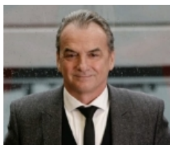
Bâtiment et Travaux Publics Rhône et Métropole

A l'intérieur, des bureaux abritent une centaine de collaborateurs des trois organisations professionnelles et leurs partenaires.