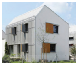
Plaques ondulées Eternit, des solutions sobres et originales pour des projets écoresponsables