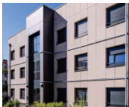
EQUITONE, panneaux architectoniques, offrant aux architectes inspiration et liberté créative.