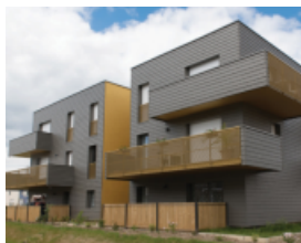
Lames de bardage Cedral, pour des façades intemporelles, en neuf comme en rénovation.

Les solutions fibres-ciment, CEDRAL, EQUITONE et ETERNIT, apportent des avantages significatifs qui contribuent au respect, voire au dépassement des exigences normatives.