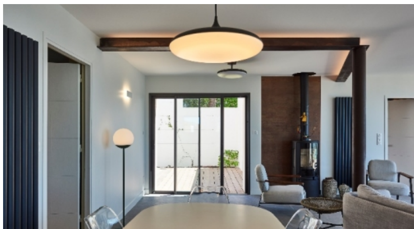
Réalisation par REBAT, maison d'architecte Dominique JAN

« Confiance » c'est le nom du lien qui nous unit depuis 1973 aux artisans menuisiers installateurs de fenêtres et portes, pour tous types de marchés : public, tertiaire, scolaire, hôtellerie, hospitalier.» Henri Janneau, fondateur du Groupe Janneau.