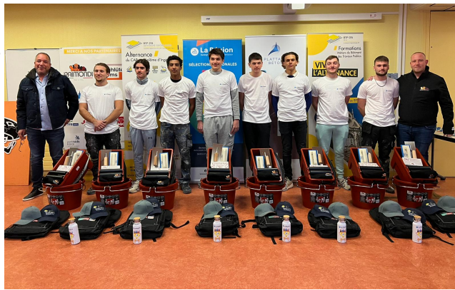
Les 8 candidats de la sélection régionale WorldSkills BTP dans la catégorie CARRELAGE et leurs formateurs.

La 1 ère phase d'inscription a été fructueuse et a hissé la région Auvergne-Rhône-Alpes en tête des régions de France avec plus de 1 600 jeunes inscrits !