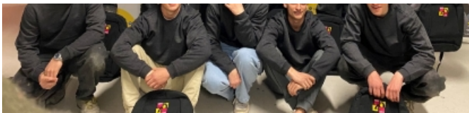
Les 11 candidats de la sélection régionale WorldSkills BTP dans la catégorie Charpente.

des formations, WorldSkills est la plus grande compétition internationale des métiers qui valorise le savoir-faire des jeunes talents.