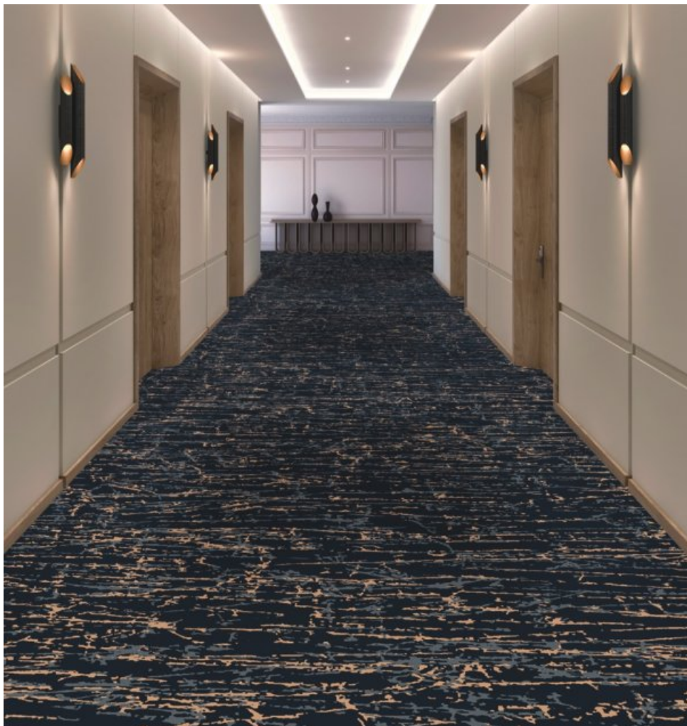
Vision of Elegance Custom, motif Ardent

Après avoir introduit Vision of Elegance , une collection de moquettes en velours haute densité, proposées en 27 références en standard, destinée à l'hôtellerie de prestige, Balsan propose un service de personnalisation pour les projets de plus de 400 m 2 .