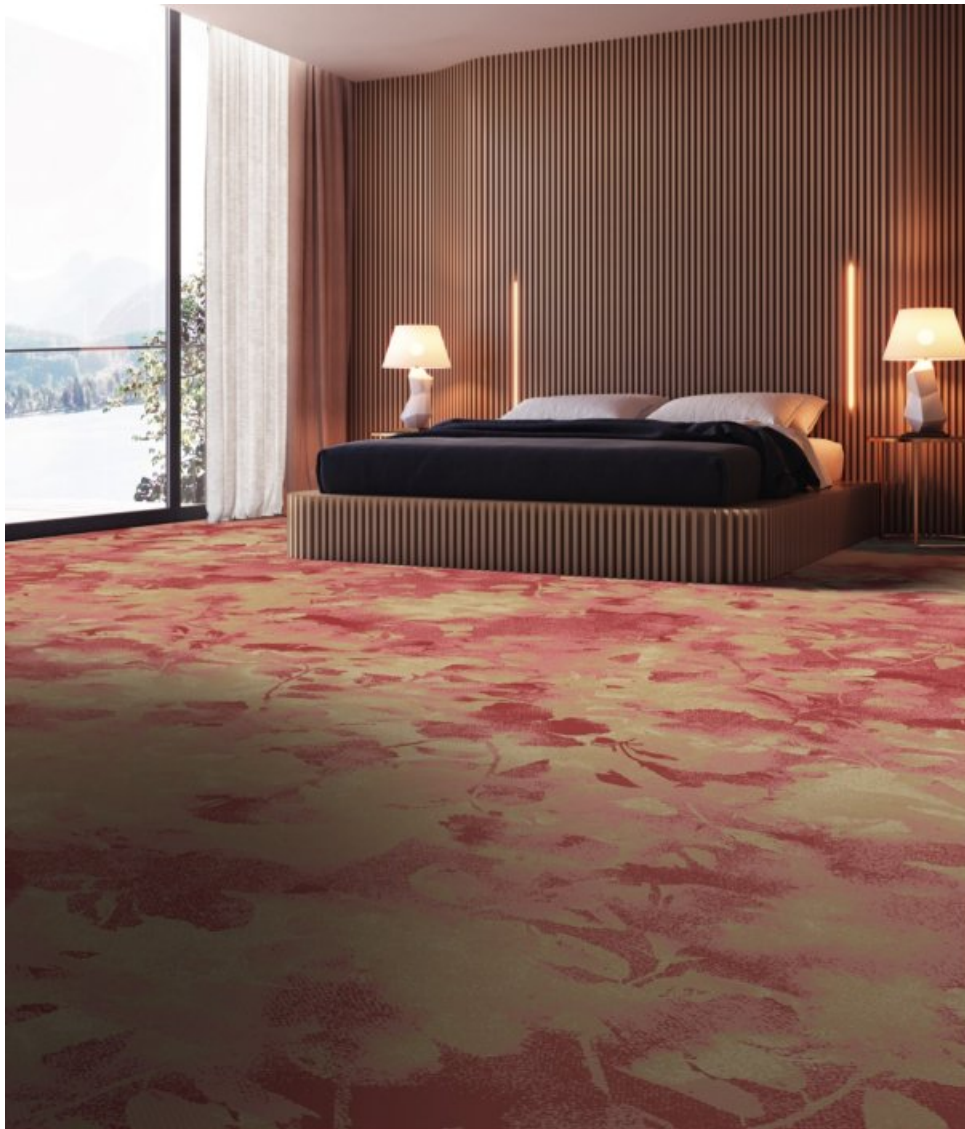
Vision of Elegance Custom, motif Spring

Balsan donne accès à sa large palette chromatique Color Vision, permettant de choisir parmi plus de 54 coloris pour une surface de 400 m 2 et 156 nuances dès 800 m 2 .