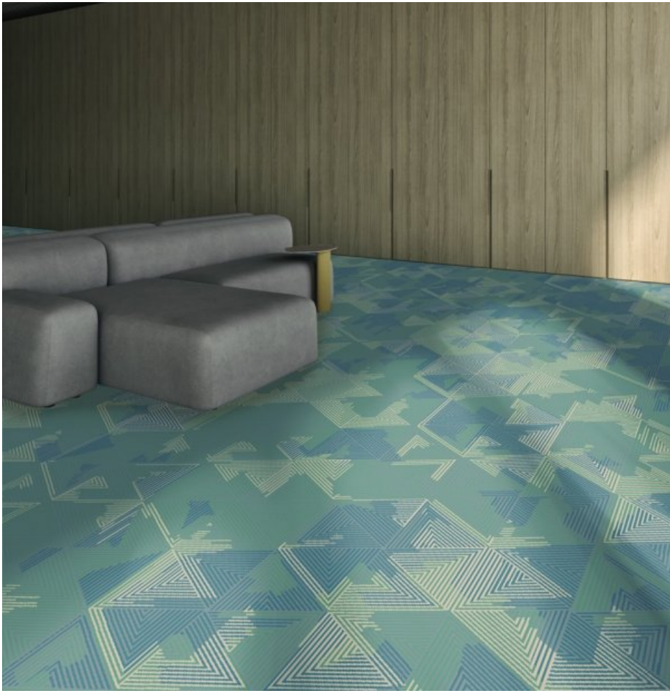
Vision of Elegance Custom, motif Prisme