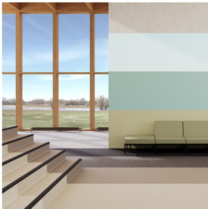
Sols, escaliers et murs : une solution tout-en-un.