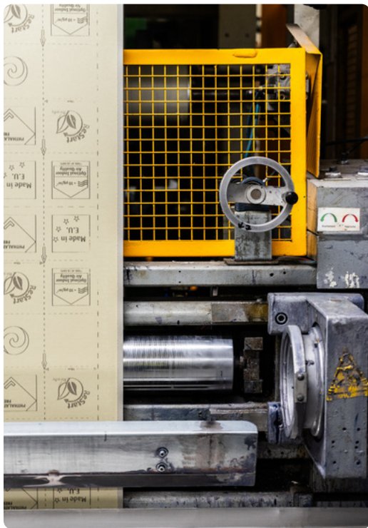
L'expertise made in France.