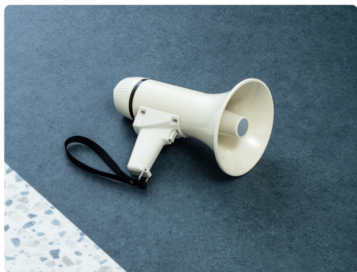
Dans toutes les gammes de sols, la collection offre un confort acoustique exceptionnel.

Enfin, les revêtements de sols possèdent une excellente roulabilité pour déplacer les lits médicalisés et autres charges lourdes, un atout pour limiter la fatigue du personnel de santé, favorisant le bien-être au travail.