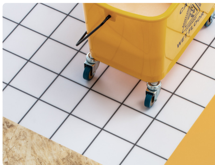
Tektanium®, un traitement de surface doté d'une grande nettoyabilité