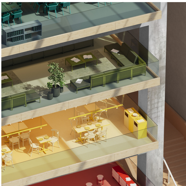
Créer des intérieurs uniques, passionnants et harmonieux.