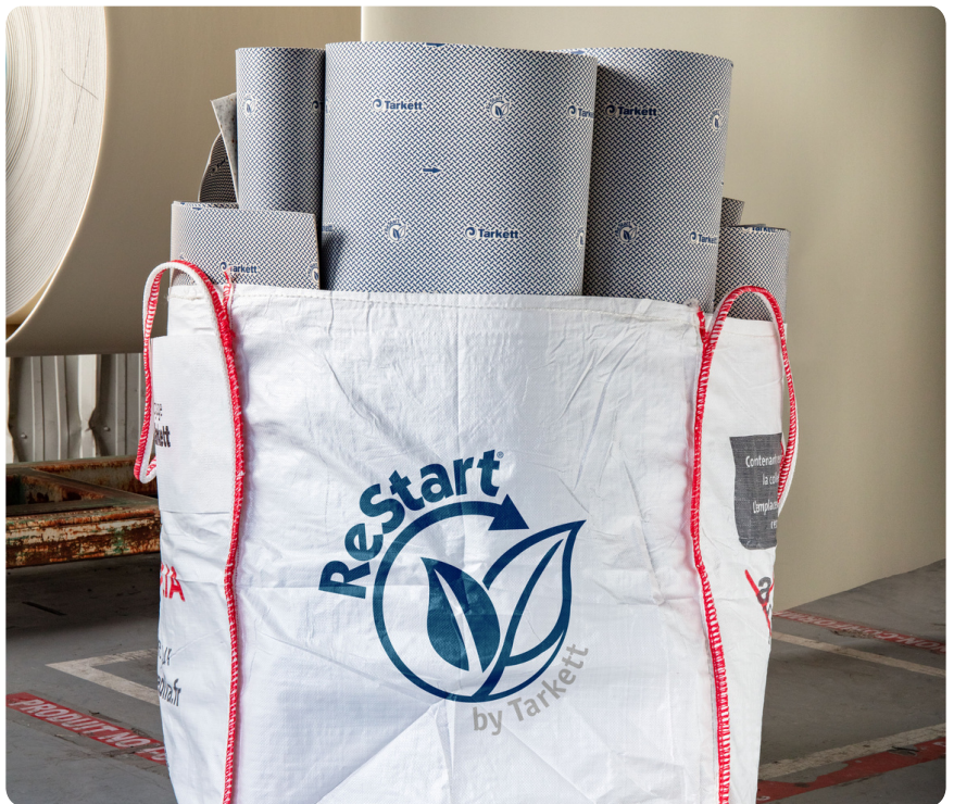
Excellence Genius peut être recyclé après utilisation via ReStart®.