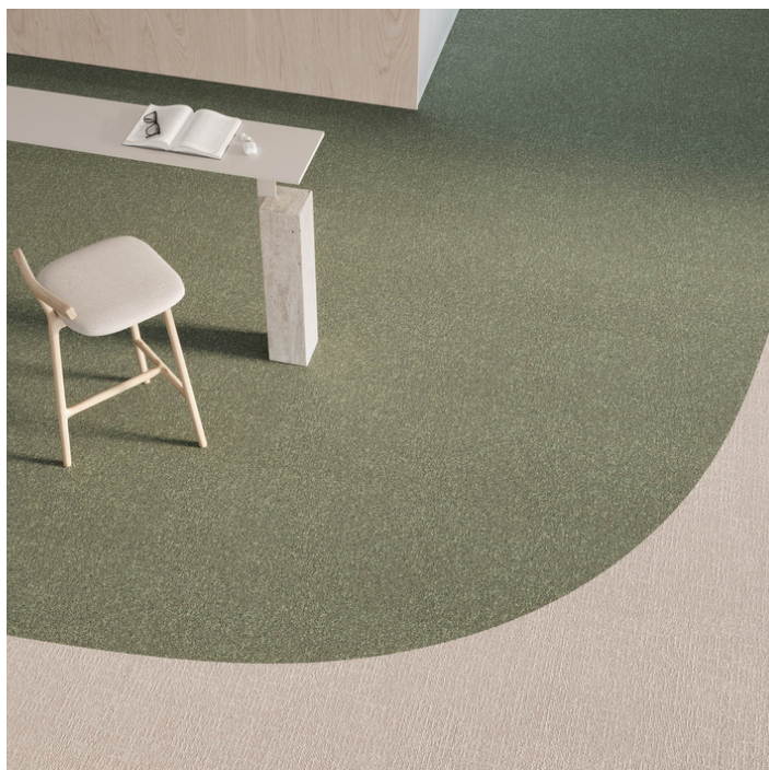
Tarkett, AirMaster® Sphere et Earth.