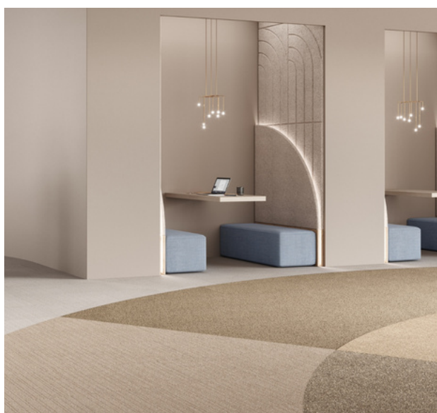
Sols Tarkett, AirMaster® Sphere, murs BAUX Acoustic Wood Wool.