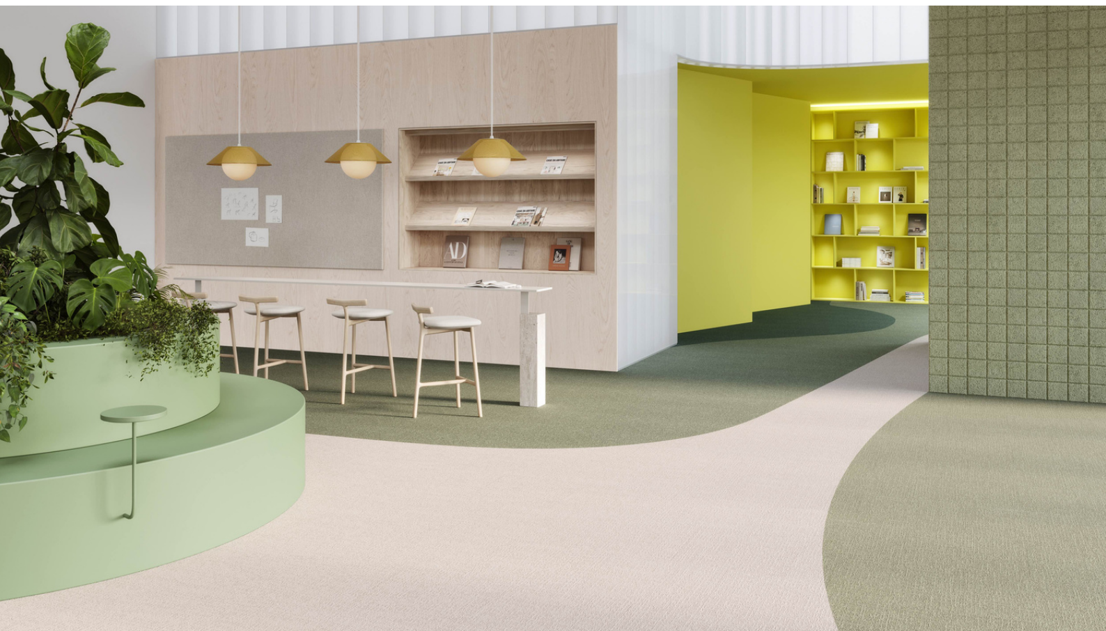
Tarkett, AirMaster® Sphere et Earth.

Avec les nouvelles collections de dalles de moquette Classic, Earth et Sphere, Tarkett renouvelle sa gamme brevetée DESSO AirMaster® unique sur le marché. Depuis son lancement en 2010, DESSO AirMaster® illustre le concept Tarkett Human-Conscious Design® - l'engagement de l'entreprise à créer des revêtements de sol bons pour l'homme et la planète.