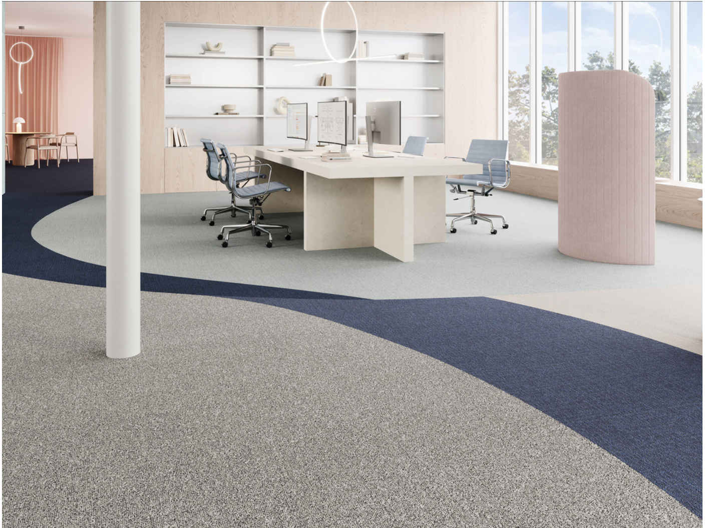
Tarkett, AirMaster® Sphere et Earth.